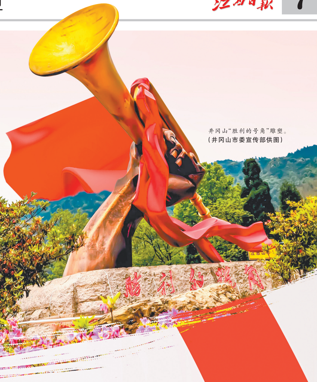
井冈山“胜利的号角”雕塑。

中国共产党人精神谱系集中体现了党的优良传统和作风,为实现中华民族伟大复兴提供了源源不断的精神力量。习近平总书记强调,弘扬以伟大建党精神为源头的中国共产党人精神谱系。在2025年全国两会召开之际,本报联合贵州日报、河北日报、河南日报,以“红色精神代代传”为主题,深入报道井冈山精神、遵义会议精神、西柏坡精神、红旗渠精神在当地的实践与传承,展现这些伟大精神的内涵、历史背景与时代价值,引导读者深刻理解中国共产党人精神谱系,传承红色基因,激励广大群众在新时代继续奋勇前行。