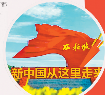
2024年拍摄的西柏坡。

行走西柏坡村,一幢幢白墙灰瓦的农家院落整洁漂亮,一条条平坦宽阔的马路通到各家各户,污水处理、卫生设施等一应俱全,绿化带相映成趣,村容村貌整洁。