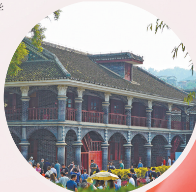
遵义会议会址。