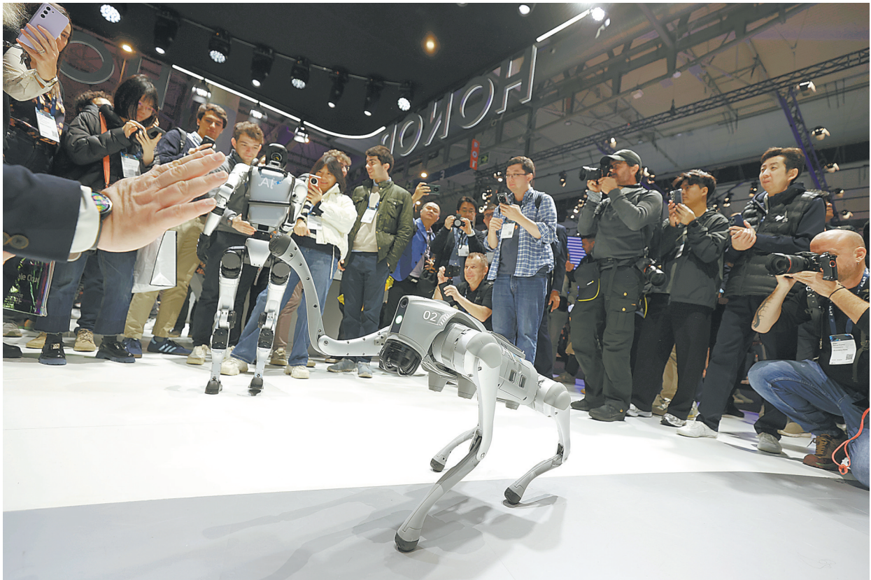
参观者与多维触觉灵巧手互动。