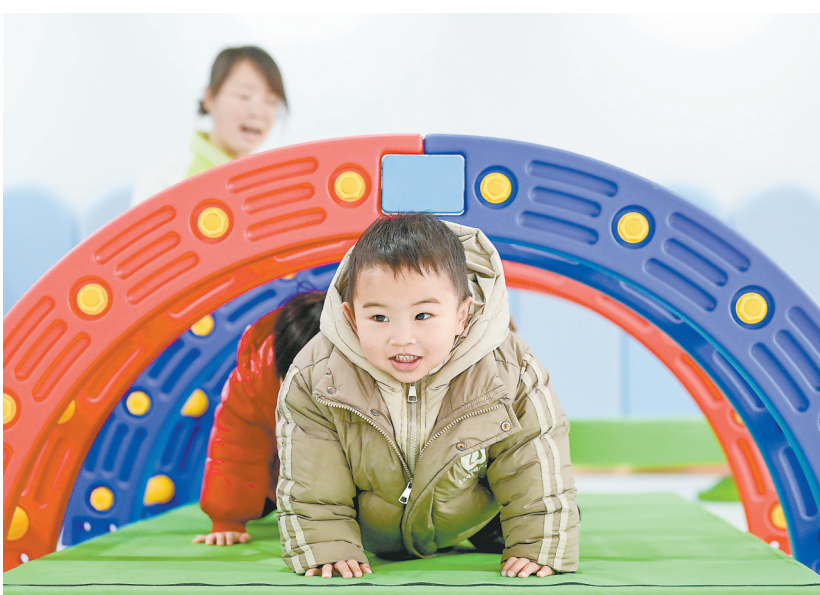
近年来，赣州市章贡区大力推进普惠托育服务体系建设，让“家门口的幸福”惠及更多群众。图为3月5日，章贡区东外街道托育中心内，孩子们在老师的陪伴下玩游戏。

陈永奇指出，全省广大妇女要与党同心、感恩奋进，深刻领悟“两个确立”的决定性意义，坚决做到“两个维护”，坚定不移听党话、跟党走；紧跟时代、建功立业，努力在科技创新、乡村振兴、基层治理上展现新作为；传承美德、弘扬新风，注重家庭家教家风建设，带头提倡移风易俗，让文明新风充盈千家万户；锤炼本领、自立自强，自觉把巾帼梦融入中国梦，依靠自己的双手创造美好生活。他要求，各级妇联组织要强化思想政治引领，（下转第2版）