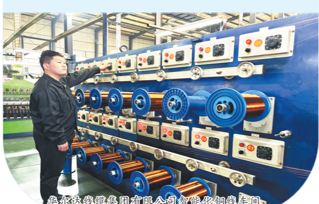
耐尔铜业生产车间