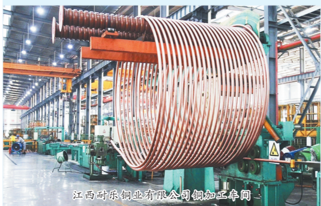
江西耐尔铜业有限公司生产车间