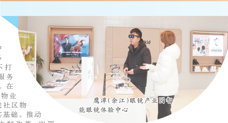
鹰潭(余江)眼镜产业园的智能眼镜体验中心

凝聚治理力量。全区有686个农村网格、73个城市网格，配备网格员3776名。实施“大学生回村”工程，动态补充一村一名大学生、222名大学生回村、进社区兼任网络管理员，建强“1+N”自治队伍，在群众推荐、民主协商的基础上，全区1040个村小组100%建立村民事