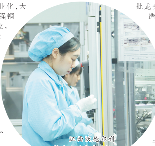
江西耐尔铜业有限公司生产车间

——“数智转改”快速推进。深化企业数字化转型诊断，2024年全区完成160家企业深度诊断工作，改造企业任务目标138家，已开展改造企业133家。其中，已完成改造的企业有105家，正在改造的企业有28家。合力支持工业园区数字化转型试点，去年9月底，余江工业园区入选江西省第二批产业集群和中小企业数字化转型试点名单，争取省级专项资金1000万元。完善数字化转型保障机制，该区出台《鹰潭市余江区推进工业高质量发展若干政策措施》《鹰潭市余江区人民政府关于印发支持制造业数字化转型的若干措施的通知》和《鹰潭市余江区“数智贷”贷款管理办法(修订)》等一系列政策，促进农商银行与6家企业签订“数智贷”合作协议，并在深度诊断、转型成效、标杆打造、服务质量、贡献突出等方面综合评价前两名服务商给予资金扶持，由区级财政分别给予20万元、10万元的奖励。保太集团获评卓越超级智能工厂，耐尔铜业入选省科技领军及入库企业。