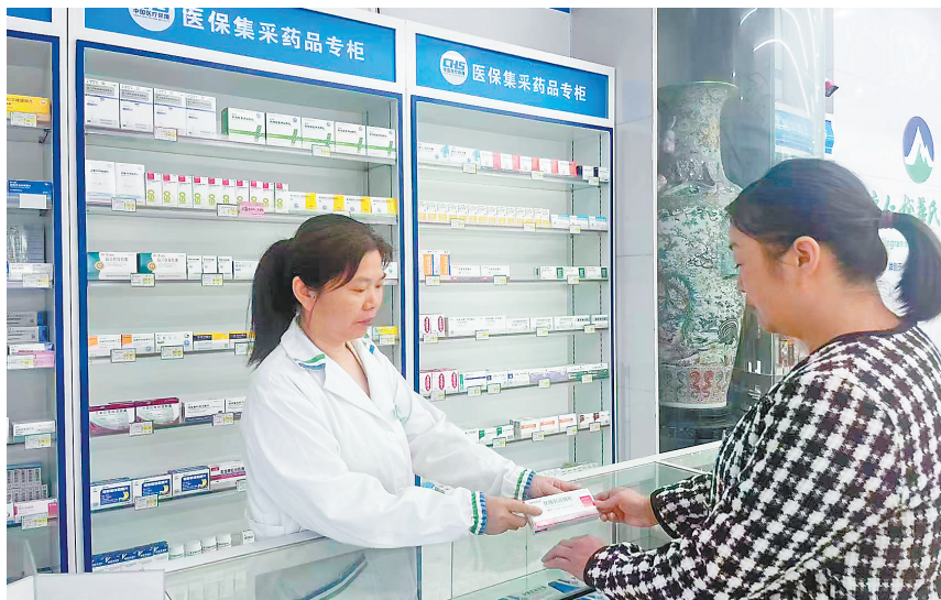
群众在药店的集采药品专柜也能买到集采药品。