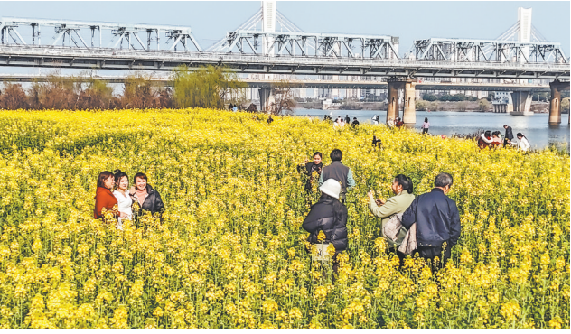
3月8日，赣江之中的南昌市东湖区扬子洲镇江心洲上，近千亩油菜花竞相绽放，吸引了不少市民前来踏青赏景，拍照留念。

局相关负责人说，该县注重乡村地名与产业发展深度融合，通过培育地名公共品牌，变“地名产品”为旅游商品，增加乡村旅游地名经济效益。 古村赋名激发了乡村旅游消费活力，该县培育了婺源绿茶、晓起皇菊、甲路纸伞等10余个“乡字号”“土字号”特色农产品品牌，5款地名标志产品入选全国“名优特新”农产品，51款产品入驻高端商超。 自“乡村著名行动”开展以来，婺源新增采集上图写生基地、旅游点、民宿、农家乐、种养基地、物流公司等信息4000余条，促进了乡村振兴。 如今，“古宅民宿”已成为婺源旅游五大特色IP之一，到婺源参观体验民宿的游客人均停留2.5天，年综合收入13亿元，间接带动就业2万余人。 “地名+直播”“地名+电商”等产业发展方式，拓宽了农民增收渠道。去年，该县农产品网络销售额达3.9亿元，增幅49%。如今，该县所有建制村年集体经济经营性收入都超过15万元，其中年集体经济经营性收入20万元以上的村占比超过80%。