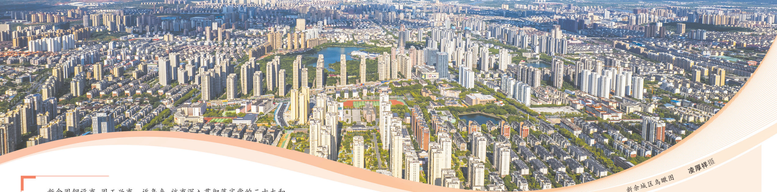
新余城区鸟瞰图

新余因钢设市、因工兴市。近年来，该市深入贯彻落实党的二十大和二十届二中、三中全会精神，聚焦“走在前、勇争先、善作为”的目标要求，锚定加快打造新型工业强市战略，围绕制造、数字、科教、文旅、生态、治理六个方面发力，深入实施“六大行动计划”，加快推动传统产业绿色转型升级，着力培育新兴产业，不断提升产业的含金量、含新量、含绿量。这座开放、包容、创新的“钢城”，高质量发展成色越来越足。