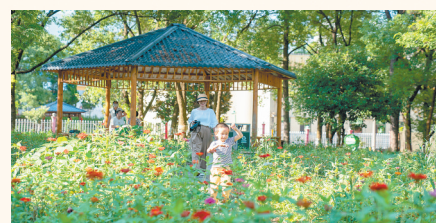
渝水区袁河街道长林小区内口袋公园

仲春时节，漫步新余，高楼林立，街巷整洁，老旧小区面貌焕然一新，市政功能持续完善，民生福祉节节攀升……一座美丽宜居的城市映入眼帘。