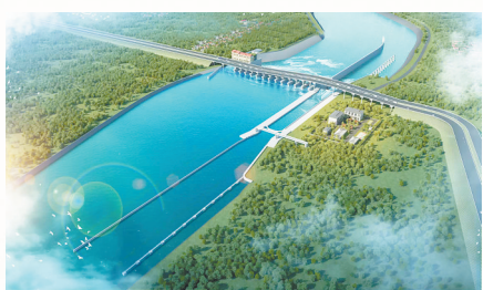
袁河航道提升工程之石洲航运枢纽效果图

量发展的硬支撑，重点谋划、推进“两重”“两新”、基础设施等领域重大项目，不断寻找绿色发展动能。2024年，该市围绕重大基础设施、产业升级、生态环保等，分两批实施市重点项目334个，其中115个亿元以上项目被列入省大中型项目，42个项目被列入省重点项目。