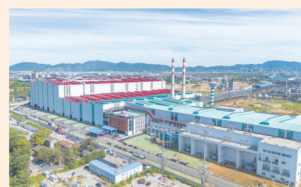
新钢电弧炉项目投产

生态愈美，离不开绿色低碳转型的功劳。2024年，新余市出台工业领域碳达峰实施方案，大力推动产业绿色低碳转型，总投资50.8亿元的新钢集团超低排放环保改造系列项目全面启动，赣锋循环10万吨、龙凯12万吨的废旧锂电池回收利用项目加快建设，新治新材料10万辆报废机动车回收拆解及零部件精深加工项目正积极推进。