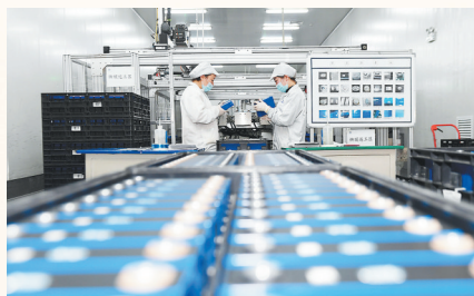
赣锋锂电池生产线

蓄势待发。2024年，新余市实施数字化转型三年专项行动，成立数字化转型促进中心，通过政策工具多样化、人才队伍