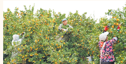
渝水区姚圩镇七里山橘园

一本古书孕文明。新余是《天工开物》成书地，在分宜县湖泽镇的凤凰山，炼铁炉火燃烧千年，埋下了新余钢铁工业的火种，孕育钢铁工业文明。如今，新余市正加快推动钢铁、锂电新能源、电子信息、装备制造等重点产业链集群发展，推动制造业数字化转型，大力打造新型工业强市。