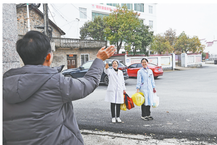
结束护理服务后,“网约护士”和患者家属告别。