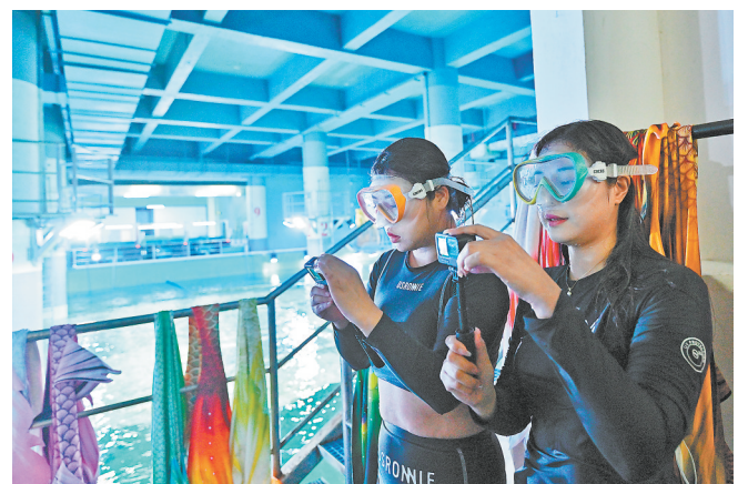
除了演出,“美人鱼”演员还要下水拍摄视频,用于水生生物保护的科普宣传。

“哇,好漂亮呀!”2月27日,位于湖口县的长江鄱阳湖水生生物保护中心,一场精彩的“美人鱼”表演正在上演。身姿曼妙的“美人鱼”伴随着舒缓的音乐,在水中与巨骨舌鱼、白鲢等鱼类一起游动、起舞,引得观众连连惊叹。