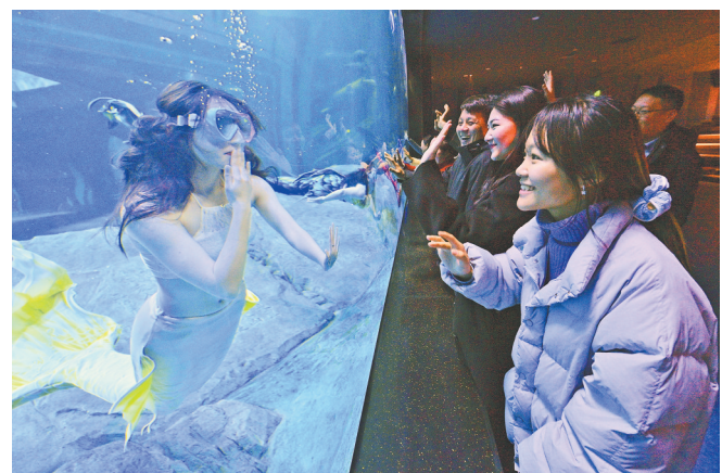
游客隔着玻璃与“美人鱼”演员互动。