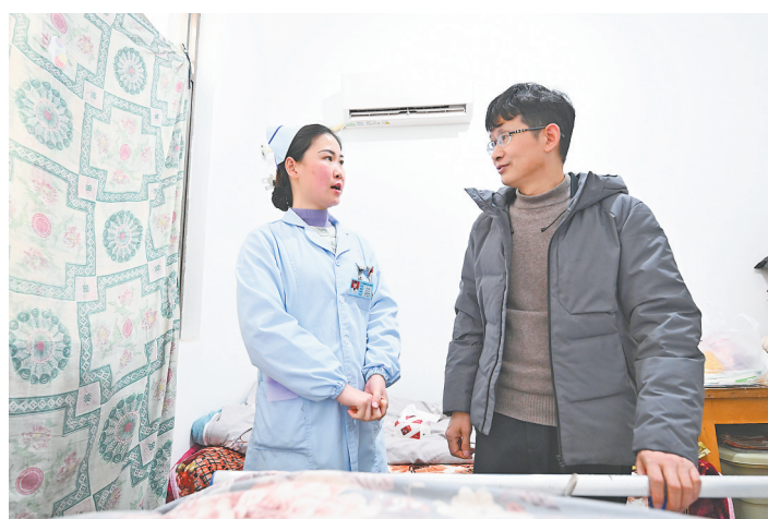
“网约护士”耐心地向患者家属讲解日常护理注意事项。