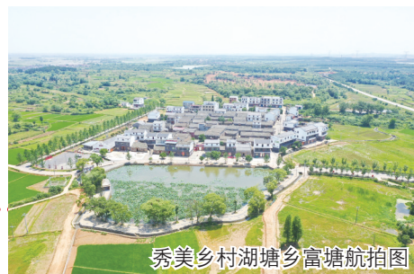
秀美乡村湖塘乡富塘航拍图