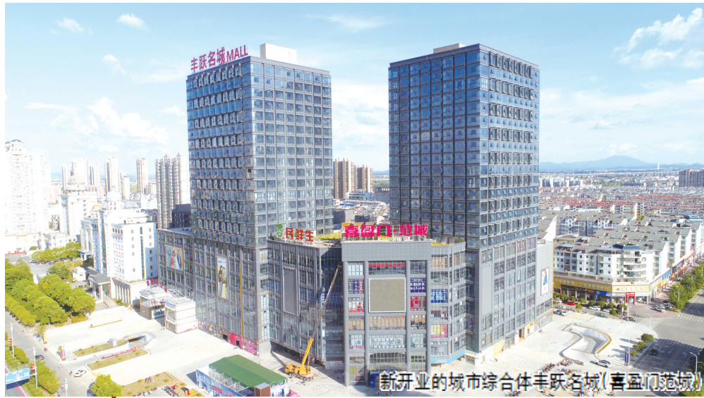
新开业的城市综合体丰城名城(喜盈门范城)

年,丰城政务服务工作并列全省第1位;组建“1+8”国有投融资平台,总资产近500亿元;坚持以人民健康为中心推进医改工作,建设2个医共体健康集团,在全省作经验介绍。坚持每月带头外出招商,换届以来,共签约项目196个,签约金额830亿元,其中引进50亿元以上项目7个,10亿元以上项目22个。三是实施创新驱动。推动出台《加快创新驱动促进产业发展的意见》,实施创新引领战略。换届以来,累计新增国家高新技术企业37家,总数达60家,2018年,高新技术企业完成主营业务收入209.8亿元,增长26.7%。与深圳工业设计协会共建省级工业设计中心,推动工业设计与制造业结合,打造工业创新设计发展高地。今年上半年,全市共新签约工业项目45个,签约资金达310.7亿元。其中50亿元以上项目3个,30亿元、20亿元、10亿元以上项目各1个,5亿元项目2个,亿元项目9个。