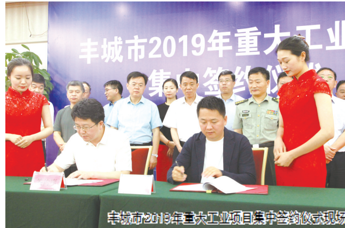
丰城市2019年重大工业项目集中签约仪式现场

近年来,丰城市牢牢把握大势,科学筹谋,化战略机遇为发展优势;凝聚共识,持续发力,咬定目标不放松;开阔眼界,解放思想,自觉把本地发展放到宜春、江西乃至全国发展大局中去思考,以思想大解放推动事业大发展;敢闯敢干,大胆创新,敢走别人没走过的路,创造性地开展工作,持续做大体量、做大份额,在全省县域经济高质量发展中担当领头羊。2018年,全市生产总值506.1亿元,财政总收入75.2亿元,总量居全省县市第二,其中税收占财政收入的比重达81.1%,为近七年最高;在全国县域经济综合实力排名中前移至第54位,各项工作赢得群众普遍赞誉。今年1至6月,全市规模以上工业增加值78.3亿元,同比增长9.3%,增速分别高于省、宜春市0.2、0.4个百分点;实现主营业务收入293.7亿元,同比增长13%,高于宜春市4.5个百分点;实现利润总额24.1亿元,同比增长14.4%,高于宜春市17.4个百分点。