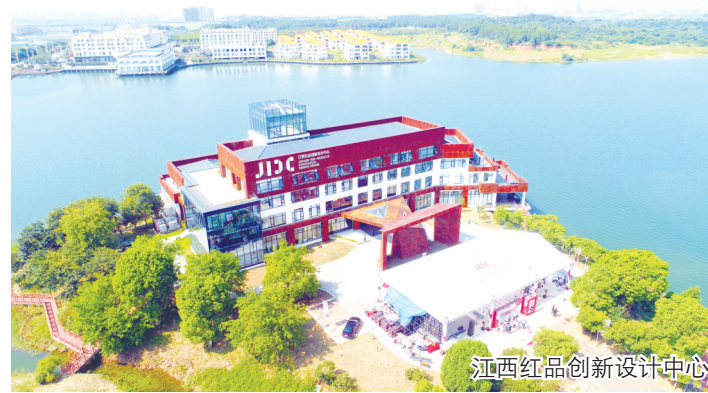
江西红品创新设计中心