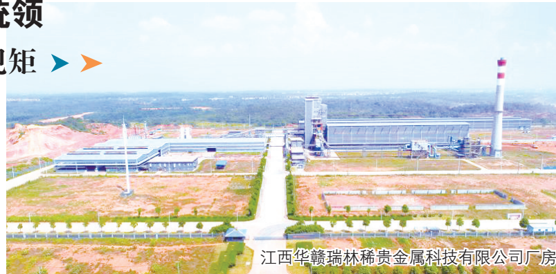
江西华赣瑞林稀贵金属科技有限公司厂房

丰城市委、市政府牢记政治建设是党的根本性建设,时刻绷紧政治建设这根弦,始终做政治上的明白人。一是始终保持对党忠诚。自觉深入学习贯彻习近平新时代中国特色社会主义思想,带头树牢“四个意识”,坚定“四个自信”,坚决做到“两个维护”,带动各级党组织书记牢记职责使命,以政治建设强化班子队伍建设,打造忠诚干净担当的干部队伍,确保各项工作的正确政治方向。二是严肃党内政治生活。严格执行新形势下党内政治生活的若干