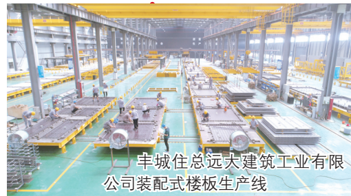
丰城住总远大建筑工业有限公司装配式楼地板生产线