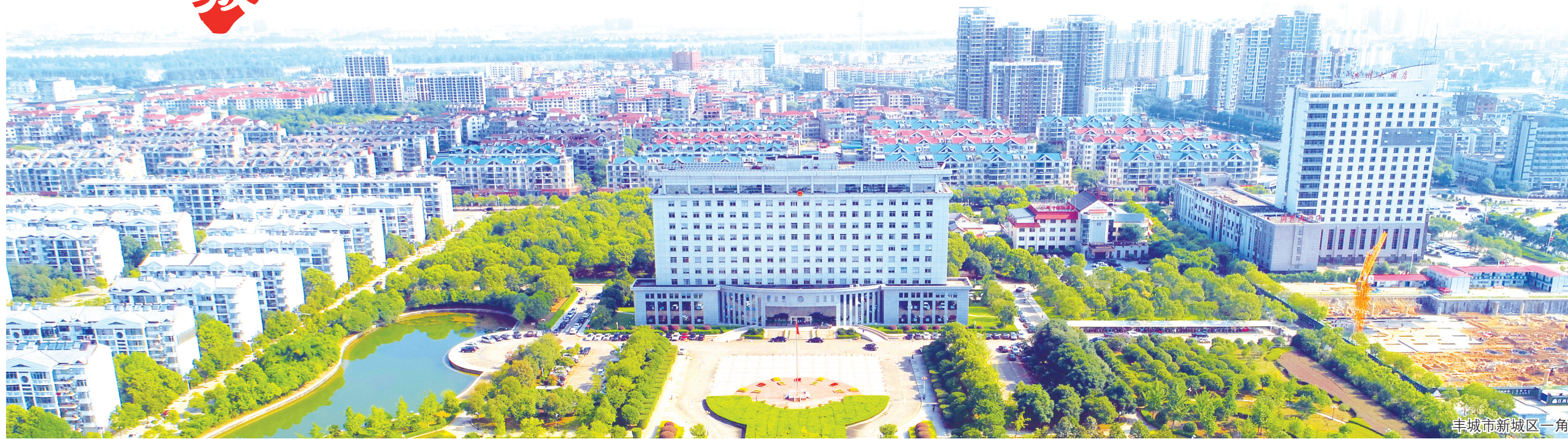
丰城市新城区一角