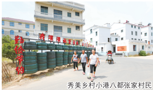
秀美乡村小港八都张家村民

选拔“三方面人员”52人。全面推行乡镇(街道)干部绩效差异化考核,有效破解“干与不干、干多干少、干好干坏一个样”的问题。四是持之以恒正风肃纪。支持市纪委监委聚焦主责主业,正风肃纪,换届以来,共立案1033件,结案数972件,处分1073人次;查处违反中央八项规定精神问题186起,处理261人。深入整治“四风”问题及“怕、慢、假、庸、散”作风顽疾,带头推进“一线工作法”,换届以来,共主持召开现场推进会70余个,解决各类问题400多个。