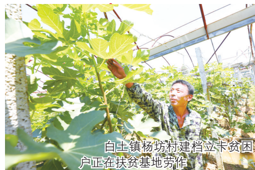
白土镇杨坊村建档立卡贫困户正在扶贫基地劳作