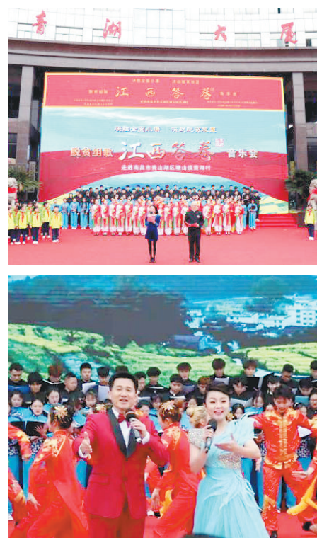
脱贫组歌《江西答卷》音乐会演出照

不久前,组歌《江西答卷》首场演出走进了南昌市青山湖区塘山镇青湖村,300余位艺术家和文化文艺志愿者同台献艺,为决胜全面小康、决战脱贫攻坚放声高歌——