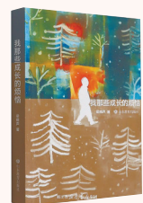
▲《我那些成长的烦恼》 梁晓声 著 山东教育出版社

《今夜有暴风雪》以北大荒40万知识青年返城为切入点，采用复线并进的结构，把知青返城的现实和对兵团生活的回忆融合在一起，成功塑造了不断成熟的曹铁强、刘迈克、裴晓芸等知识青年形象。