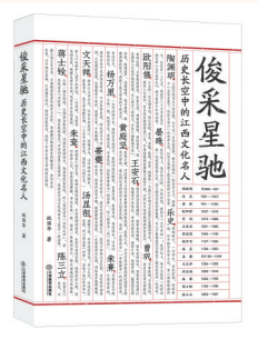
▲《俊采星驰》 祝国华 著 江西教育出版社

在江西文化史乃至中国文化史上有许多多才华横溢、名存千古的人物，这些江西文坛巨星曾叱咤文坛、名噪一时，镶嵌出璀璨的江西文学星空。日前，《俊采星驰：历史长空中的江西名人》一书由江西教育出版社出版发行。该书从星光熠熠的江西历史名人中遴选出15位文化名人，通过挖掘他们身上鲜活的历史故事，塑造出更为丰满、立体的文化名人形象，为广大读者打开了底蕴深厚的江西文化宝藏。