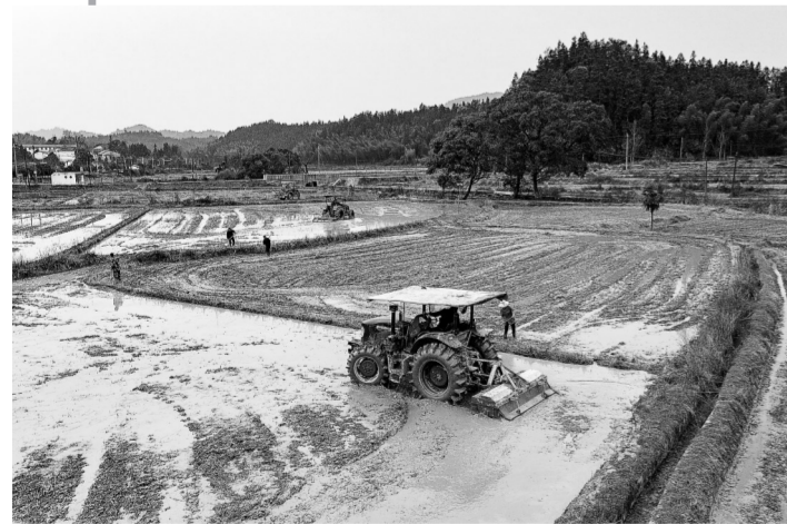
2月22日，新余市仙女湖区凤凰湾办事处东坑村，多台农机“抱团”为农民提供春耕备耕服务。该市通过引导组织农业社会化服务，实现农业生产向高质量高效转变。