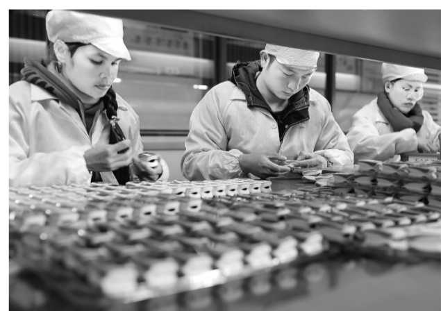
2月24日，万年县芯智微科技有限公司员工在检测指尖式脉搏血氧仪。该公司针对农村老年人健康需求，研制出一款指尖式脉搏血氧仪新产品投放市场。

南康区拥有家具加工制造、销售流通、专业配套、家具基地等为一体的全产业链集群。近年来，该区充分发挥国家电子商务示范基地的示范引领作用，创新优化平台政策、发展模式、开放市场等要素功能配置，依托家具产业基础和赣州国际陆港、南康家居小镇等特色优势，全力推动区域电商与家具产业深度融合。2022年，南康家具总产值2515亿元，活跃店铺数近2万个，家具电商交易额近700亿元。