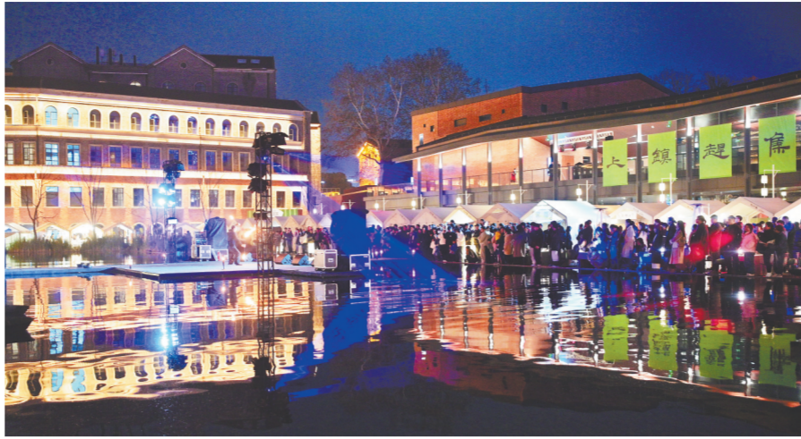
2月24日晚,陶然集的火舞表演吸引大量游客停下脚步,驻足观赏。