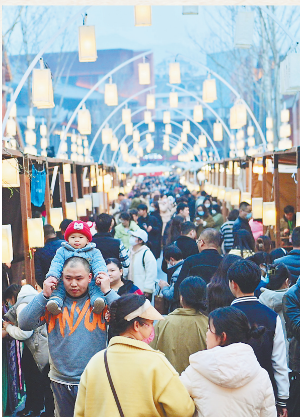
▼2月25日,陶溪川文创街区的艺术市集陶然集迎来创办以来的第二次开集。

景德镇有着2000多年的冶陶史、1000多年的官窑史、600多年的御窑史。“匠从八方来,器成天下走”的景德镇因瓷而生、因瓷而兴、因瓷而名。如今,千年传承的制瓷技艺和文化记忆成为业态创新的“沃土”,瓷都也显现出越来越多元化气息,“古老”和“时尚”的完美交融,让未来的景德镇拥有了更多的可能性。