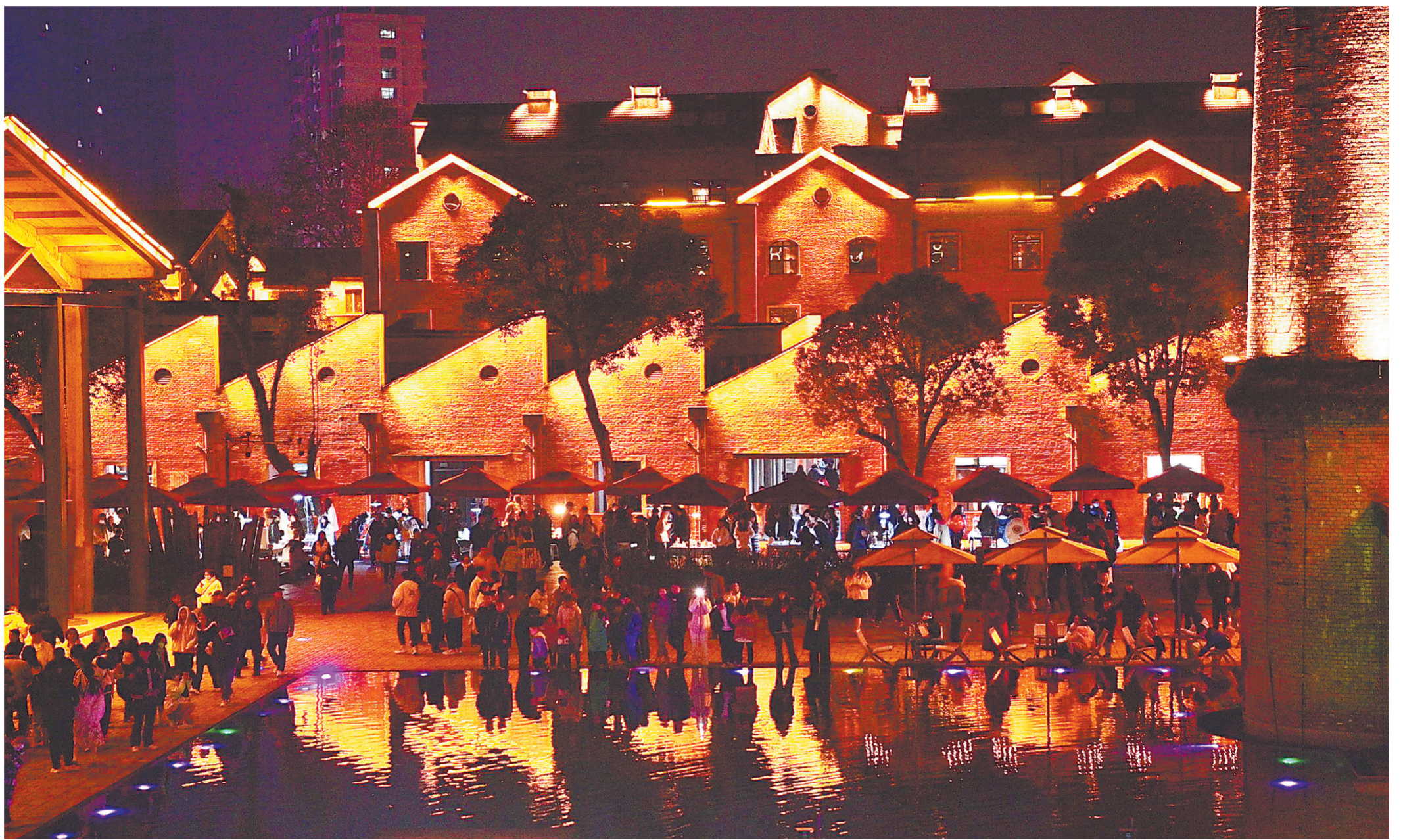
2月25日,夜幕下的景德镇陶溪川文创街区,灯影幢幢,人流如织。其中的创意集市已成为许多“景漂”“景归”们的青春地、梦想地。