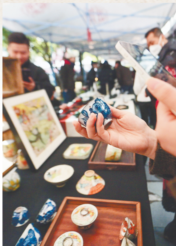
▲2月25日,乐天陶社创意市集内,一名主播在向网友们介绍陶瓷杯。