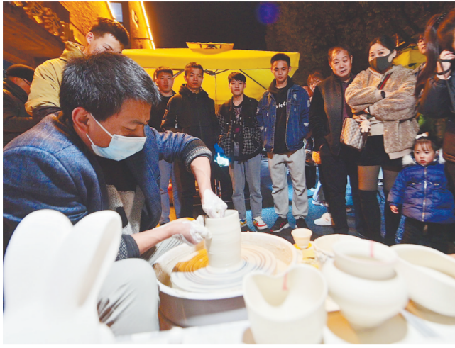
2月25日晚,陶溪川创意集市内,技艺娴熟的老师傅在摊位上展示手工拉坯制瓷技艺。