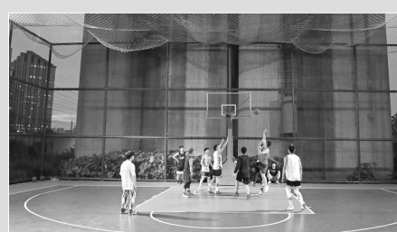
▲市民在位于高铁桥下的浙江杭州钱江世纪城体育公园打篮球(2022年9月20日摄)。