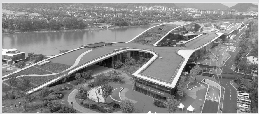
▲这是2023年8月24日拍摄的空中俯瞰杭州富阳水上运动中心(无人机照片)。