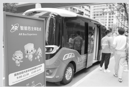
▲9月12日，媒体记者在杭州亚运组举办的亚运村媒体开放日活动中体验AR智能巴士。