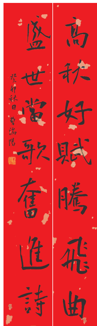
楷书对联《高秋好赋腾飞曲，盛世当歌奋进诗》曹端阳书