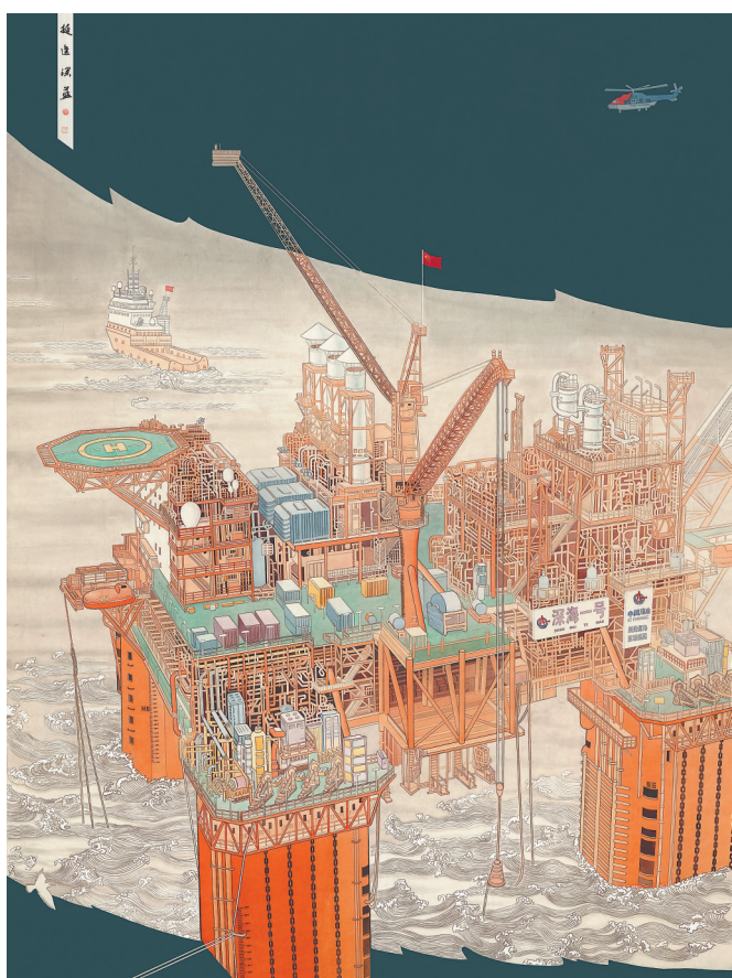
国画《挺进深蓝》廖宝剑绘