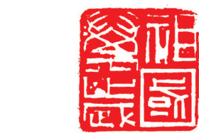
篆刻《祖国万岁》 尧在通刻