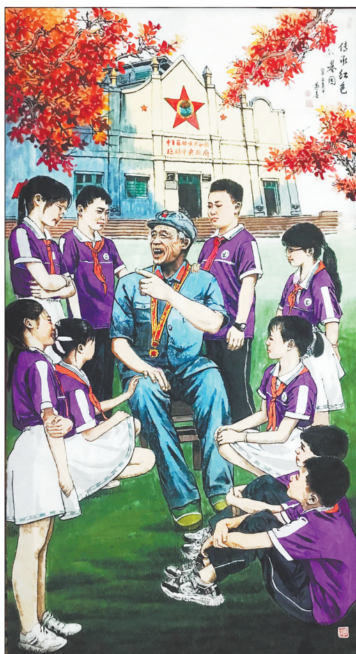
国画《传承红色基因》李遇春绘