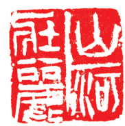
篆刻《山河壮丽》 陈维刻