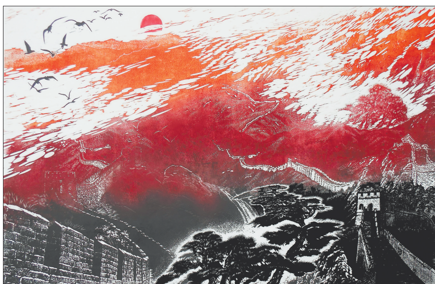
油印套色版画《龙舞东方》刘石林作