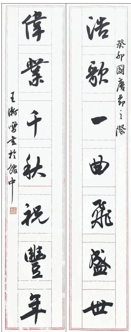
行书对联《浩歌一曲飞盛世，伟业千秋祝丰年》王建民书