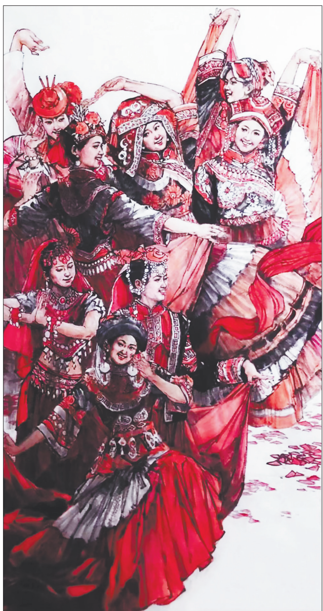
国画《盛世欢歌》郭江绘