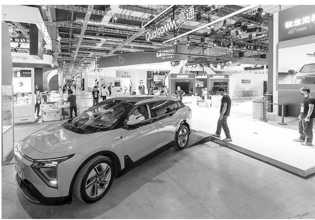
11月2日,一辆搭载高通芯片的智能电动汽车准备驶向高通展位。