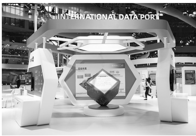
这是11月2日在技术装备展区临港展示区拍摄的国际数字经济产业园展台。