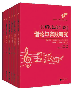
▲《江西红色音乐文化系列丛书》 熊小玉 主编 百花洲文艺出版社

《江西红色音乐文化系列丛书》是目前针对江西红色音乐文化理论研究比较全面的学术著作，对江西红色音乐的传承与发展有积极推动作用。