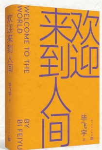
▲《欢迎来到人间》 毕飞宇 著 人民文学出版社

在小说中，我们发现了与傅睿截然不同的另外两个人物，一个是他的妹妹傅智，另一个是他的同门郭栋。与傅睿的天资聪颖和被母亲悉心呵护不同，傅智资质平平，“她平庸，她的先生更平庸”。郭栋虽同属