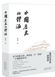
▲《中国历史的体温》 穆涛 著 百花文艺出版社

穆涛作品的可贵之处，还在于螺蛳壳里做道场，“小”说里含大乾坤。正如王尧所说：“他是宏观着眼，微观落笔，在