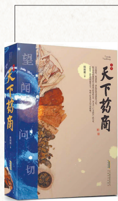
▲《天下药商》 欧阳娟 著 安徽文艺出版社 时代出版传媒股份有限公司

祝天下母亲都能被叫得出名字。祝每一个她们能在同生活的抗争中,拥有自己的独立人生。也愿我们都如《老人与海》中坚持不懈的渔夫,“我最终将穿越我的大海,拖回只剩骨架的大鱼”,我就是我,千帆过后,春和景明。