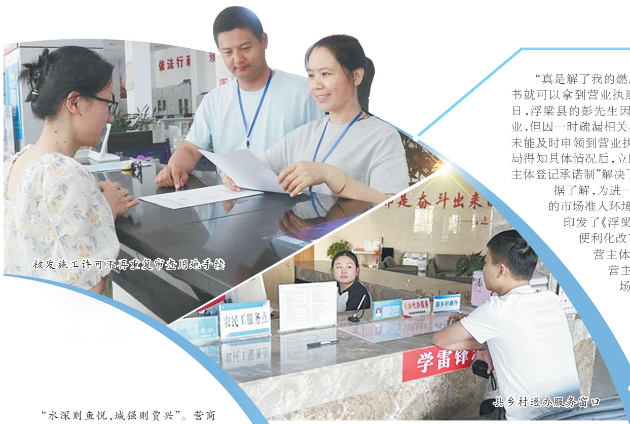
核发施工许可不再重复审查用地手续