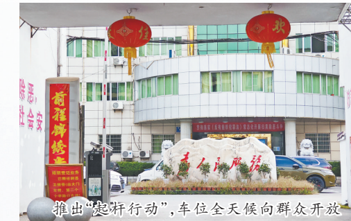
推出“起杆行动”，车位全天候向群众开放

是营商环境试金石”的理念，浮梁县法院打造“梁苑家和”家事审判品牌，搭建“全方位、广覆盖、多层次”家事纠纷化解平台。目前，县法院家事纠纷诉前化解500余件，家事案件调解撤诉率达85%。在峙滩镇梅湖村设立“共享法庭”，基层群众在家门口即可获得线上调解、网上立案、在线诉讼、法律咨询等司法服务，全力构建共建共享的基层社会治理新格局。