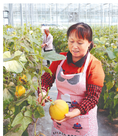
村民在蔬菜大棚工作，实现家门口就业。

江西清华珠宝有限公司通过提供技能培训，培养“珍珠女”，增设就业岗位、租赁村集体湖面等方式，直接或间接解决了500余名劳动人口就业问题，带动农户逐步走上致富路，提升了村集体收入。目前，该县有“珍珠女”4000余名，珍珠养殖面积3万余亩，年产淡水珍珠110余吨，珍珠产业链不断延长，珍珠相关产业年产值20亿元。