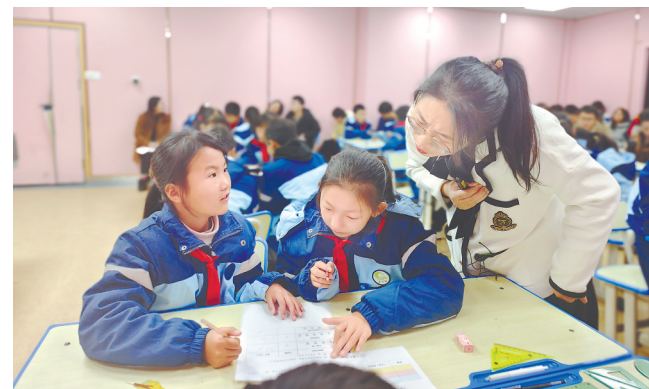
日前，民进南昌市青山湖区总支组织“非零空间”教学研究基地的教师，来到该区胡家小学开展送教下乡活动。教师们通过设置教学开放性的思维问题，引导学生思考，建立数学模型，在合作探究中利用数形结合解决实际问题。

连日来，青云谱区各街道密集举办专场招商引资推介暨项目集中签约活动，涵盖数字经济、人工智能、商贸服务、医疗器械、民生服务等链上项目。该区将进一步健全产业链长制，强化产业扶持力度，促进产业链自主发展、规范发展，并积极引进链主企业，为经济发展、民生改善增添新动力。