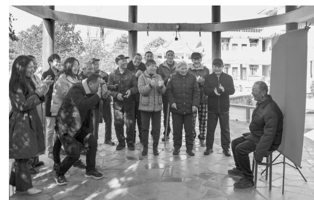
1月6日，万年县摄影家协会志愿者来到石镇福利院，为老人拍摄幸福照，让老人们感受社会的关爱和温暖。

近年来，西港镇人大代表通过实地走访、考察调研、群众座谈、村民小组会议等方式，深入调研民生实事项目建设情况，群策群力，推动乡村治理从“纸面”落到“地面”，有效改善了西港镇人居环境。在推进重大民生实事项目建设中，西港镇坚持问需于民，实行代表票决，推动提升民生实事项目决策民主化，把民生实事办到群众的心坎上。采取“每月一评比、每季度一调度”方式，推进乡村环境整治提升。