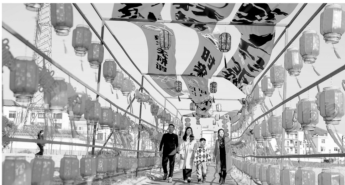
2月11日,市民在瑞昌市夏畝铜源剪影文化园游玩。春节假期,当地市民纷纷放松心情走出家门,尽情享受休闲好时光。

该市公安局还综合运用“声、屏、网、微”等多种媒介立体发声宣传,对全市电诈案件发案区域、发案类型、受骗群体深度研判,对高发区域和易受骗群体开展精准宣传,并在全市所有银行网点和通信运营商网点设置警方提示牌,增设反诈提示流程,签署反诈承诺书。春节期间,民警们充分利用节假日期间“万家团聚、万众返乡”时机,采取“集中宣传+敲门入户”的形式,走村入户开展防范电信网络诈骗宣传活动,营造人人识诈、全民反诈的社会氛围。