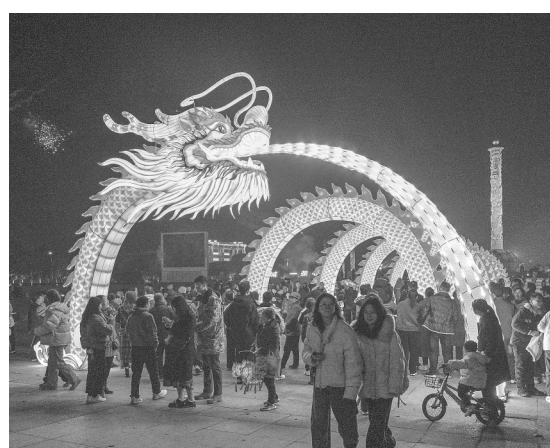
2月11日,婺源县紫阳公园文化广场,“龙腾盛世”巨型生肖灯笼亮相,吸引着许多市民和游客前来观赏。