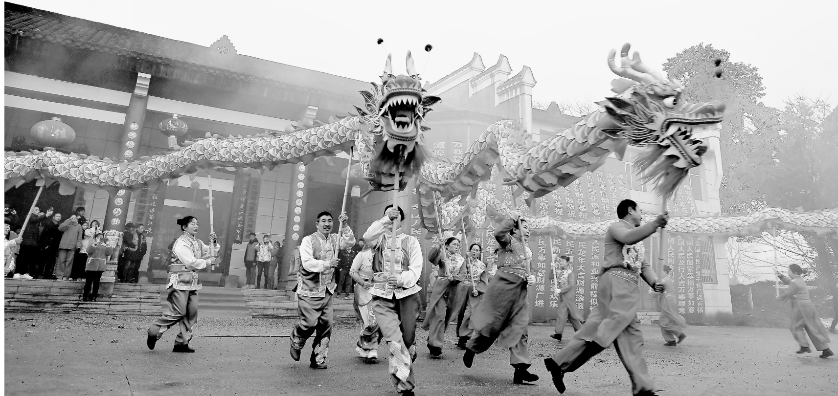
2月8日,万载县潭埠镇池溪村村民在文化礼堂前舞龙迎春。当日,该村举办主题为“大地欢歌迎新春 五谷丰登庆丰收”的乡村春晚,舞龙、得胜鼓、舞狮、小品、花灯戏等节目精彩上演,丰富了群众的文化生活。