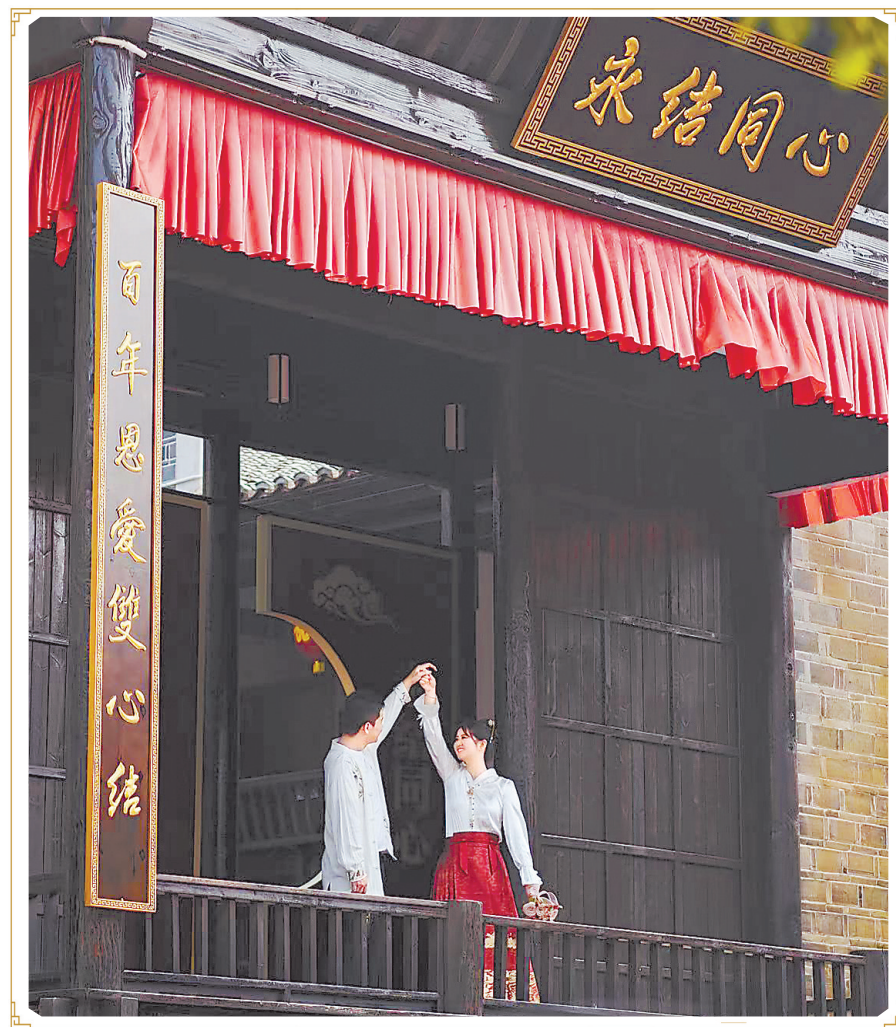
古色古香的南昌县婚姻登记处。