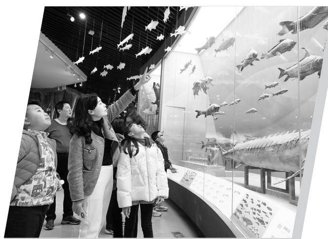
游人在重庆自然博物馆参观。