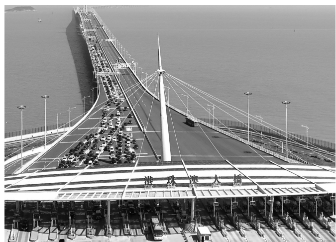
超13万人次！港珠澳大桥单日出入境客流量创历史新高

水利部农村水利水电司相关负责人表示，根据2024年农村水利水电工作要点，加快灌区现代化建设。扎实做好增发国债资金支持的1000余处灌区项目监管，协调好与相关项目衔接配套。加强部门协作，统筹大中型灌区骨干工程与田间工程建设，优先将具备灌溉条件的耕地建成高标准农田。同时，强化农业节水供水管理，持续推进灌区和灌排泵站标准化管理等。