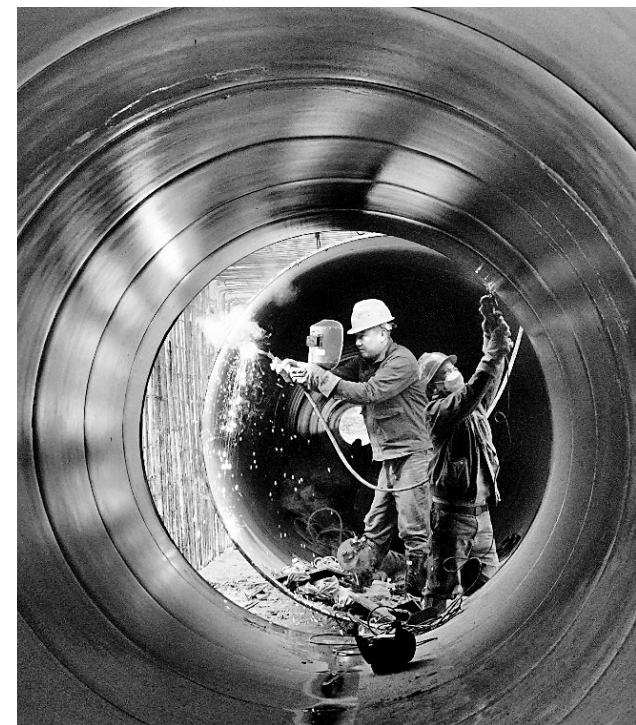
日前,宁都县梅江灌区黄陂河倒虹吸项目现场,工人正在焊接管道。梅江灌区工程是水利部对口支援赣南等原中央苏区的大型灌区工程,预计3月底总干渠可全线贯通,为春灌提供保障。

所的高层次人才受聘成为“科技经理”,带着技术、成果、团队,走进生产一线,为企业转型升级“把脉”、赋能,同时也从一线寻找科学研究的新需求、新方向。共青城市在路径上创新。通过“研究院+产业园”的产研“联姻”,“前院”孵化项目、“后院”转化成果。比如,共青城市低空数字经济应用技术研究院面向水利、交通等行业,打造系列无人机组网遥感典型应用解决方案,科研产品实现了订单化