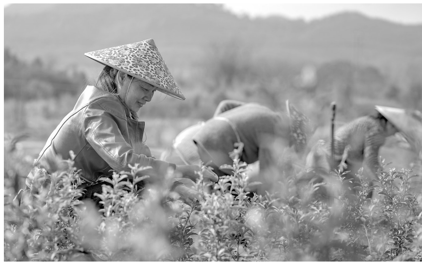
3月19日,分宜县湖泽镇尚睦村黄茶种植基地,茶农正在采收新茶。春分前后,该县数千亩黄茶种植园相继进入春茶采摘期。