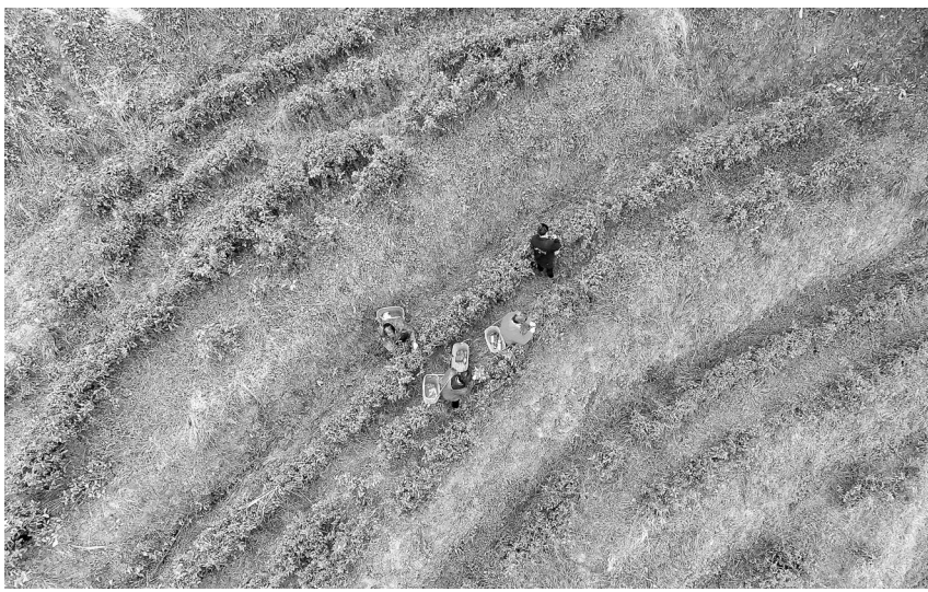
3月21日,万载县艾湖乡上峰村的高山茶园,茶农正在采摘春茶。随着气温升高,该高山茶园进入采摘期。