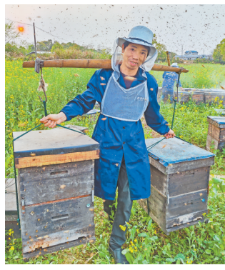
▲蜂农转场。 ▶蜂农线上直播卖蜂蜜。

弋阳县拥有意大利蜂4万多群、中华蜜蜂1.5万群,有职业蜂农400多户。每年,有半数蜂农在县农业农村局和养蜂协会的组织安排下,与安徽、江苏、内蒙古等地建立紧密联系,采用“飞地”养蜂方式;另一半蜂农则在家养蜂,兼顾种田。不管是走出去的,还是留下来的,弋阳养蜂人总能演绎不同的精彩。