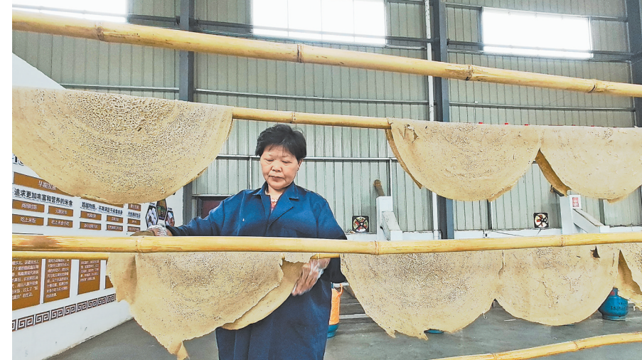
刚出锅的懒豆腐晾在竹竿上。