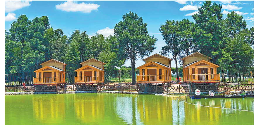
东边村锦园生态景区。