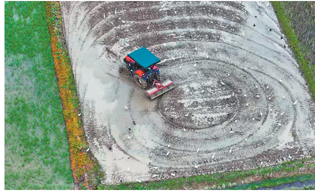
5月5日，在乐平市镇桥镇，一辆旋耕机来回翻耕水田，一群鹭鸟闻声而至，在水田里觅食、嬉戏，构成一幅鹭鸟翩跹农耕的美丽画卷。

为避免在捕蛇过程中对围观人员造成伤害，消防员分两组，一组负责周围戒备，以防捕捉时，蛇受到惊吓将群众咬伤；另一组由消防员佩戴好个人防护装备，准备好编织袋、捕蛇器等工具，进入室内捕捉。搜寻一番后，消防员在养猪场一角落发现蛇的踪影，随即用捕蛇器按住蛇头，紧紧抓住它的七寸，将其装入袋中。“是眼镜蛇，有毒！好在处理及时，不然后果难料。”最后，消防员将蛇带至安全区域放生。