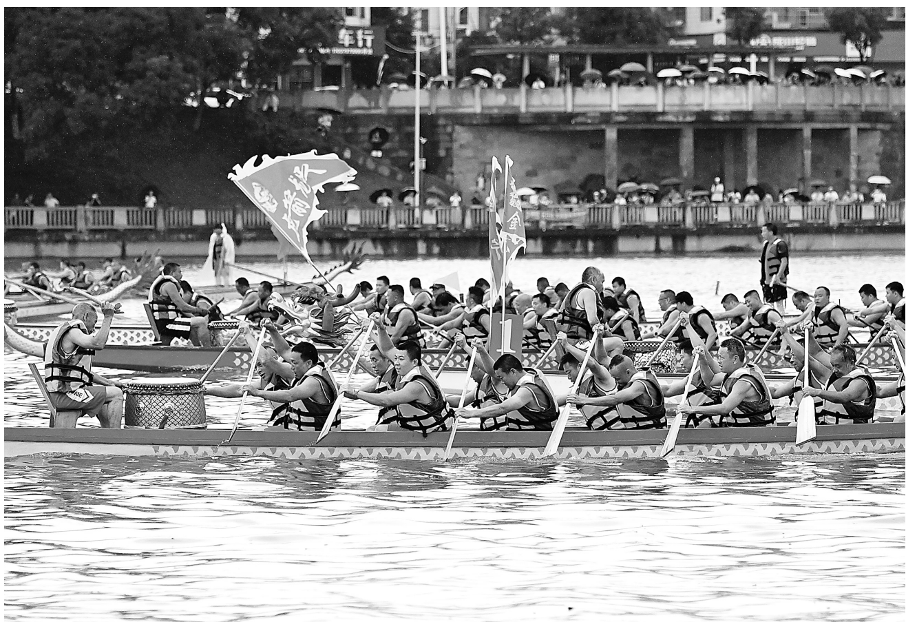
6月10日,宁都县举行端午节龙舟赛。该县11支队伍同场竞技,队员们齐心协力、破浪前行,岸边观众欢呼雀跃,为参赛队员加油助威。

艺术与民俗同频共振,文旅休闲游热情不减。综观全省,主打一个“乐游江西”,全省各地共推出近千项文化和旅游活动,涵盖展览展演、主题活动、优惠政策等。整个假期,文商旅体多业态持续融合联动,激活“吃住行游娱购”等全方位文旅消费。