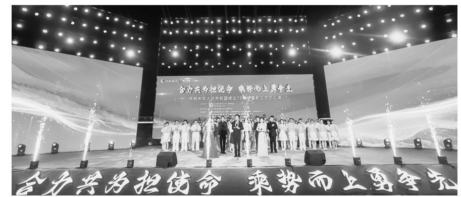
中，赣江控股集团全体职工用大合唱《赣江之歌》，展示出了团结奋进、拼搏进取的精神面貌，铿锵激昂的歌声将晚会推向了高潮。

伴舞《小哥》和诙谐幽默的小品《误会了》为观众带来无尽欢乐。第二篇章是“礼赞祖国心飞扬、盛世中华韵悠长”，歌舞情景剧《人世间》带领观众走入充满情感的世界；乐队表演《我爱你中国》等三首风格各异的歌曲释放出无穷魅力；舞蹈《珊瑚颂》和红梅串烧《青春中国》传递出积极向上的拼搏力量。第三篇章是“合力共为志如钢、乘势而上创辉煌”，国乐表演《盛世国潮》展现了传统文化的底蕴和魅力；歌舞《我的梦》唱出奋斗者对梦想的执着追求；南大一附院赣江新区医院医护人员带来的《向光而行》，传递出“医者仁心”的坚定信念。在压轴戏