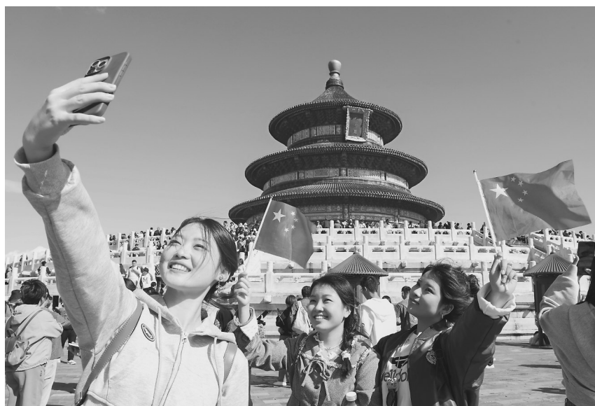
10月1日，游客在北京天坛公园祈年殿前拍照留念。

在天津，交通运输部部门做好“三站一场”客流组织，密切关注铁路、民航客流变化情况，及时加开车次、航班，加强运力保障。河北省交通运输厅强化运输服务保障，加大旅游重点地区及景区运力投放，引导企业开行旅游专线、旅游直通车。