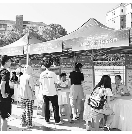
招聘会现场众多求职者积极参与