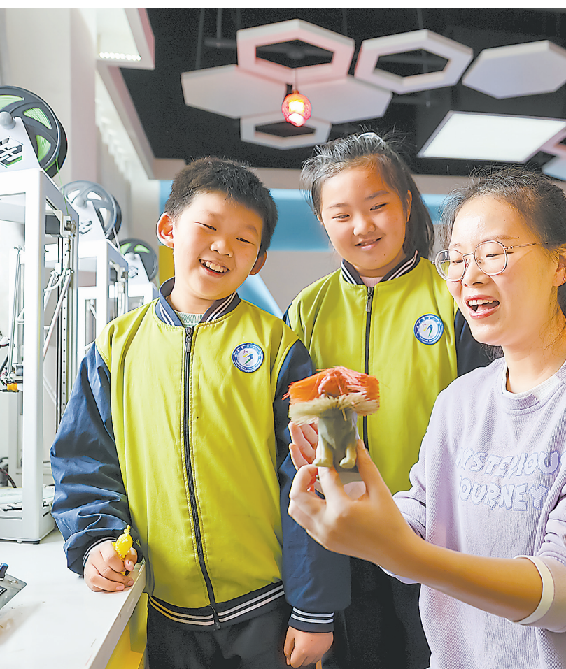
11月20日，瑞昌市第七小学学生在3D打印教室学习3D打印设备原理及设计创作等。该校通过开设特色科技课程，将3D打印设备引进校园，让学生们体验3D打印创作，动手动脑，享受科技带来的乐趣。

本报讯（全媒体记者张武明）11月26日，省长叶建春在省信访局接访，现场协调解决群众反映问题。他强调，要深入贯彻习近平总书记关于加强和改进人民信访工作的重要思想，发挥基层优势，压实各方责任，全面排查、及时化解矛盾纠纷，带着感情妥善解决群众实际难题，切实维护群众合法权益和社会和谐稳定。 在接访现场，叶建春先后与三批来访群众面对面交流，与有关方面负责同志现场研究解决问题办法。南昌市新建区望城镇麦山村村民代表反映安置房建设未如期落实问题，叶建春详细了解安置房项目建设情况，要求在保障房屋质量的前提下优化施工方案，确保按照之前接待群众时承诺的时间节点完成建设，并有序组织群众收房。他对村民代表说，不管因为什么原因，安置房没能如期完工，都说明政府有关方面工作不到位。请你们回去后向村民转达我们的处理意见，让大家安心等待。在瑞昌市某楼盘购房的市民王某，因迟迟未拿到交房消息，通过网络信访反映问题。叶建春了解楼盘交付进度及其滞后原因，在与工作人员商讨后，向王某给出了具体的交房时间。他指出，保交楼、保交房工作中出现的信访问题是共性问题。省直有关部门要强化研究，结合实际出台指导意见，更好帮助各地解决类似问题。要将心比心、感同身受，对群众反映问题多关注、早处置，切实为群众排忧解难、化解心结。 上犹县安和乡鄱塘村村民代表反映，当地采石场在爆破过程中造成村民房屋出现裂缝，砂石车频繁行驶导致村内道路受损。叶建春要求当地政府委托第三方科学鉴定村民房屋受损情况，向村民讲清楚实际情况，同时做好生态环境治理工作，守护好一方绿水青山。叶建春还与在场的赣州有关负责同志协商处理章贡区一名快递员劳务费遭拖欠的信访问题， （下转第2版）