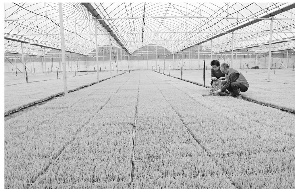
▲在广昌县莲蒙农业科技智能化育秧工厂，播种、覆土、浇水等流程均实现机械化操作。图为3月20日，工人在暗化催芽室查看秧苗长势，准备适时移栽。