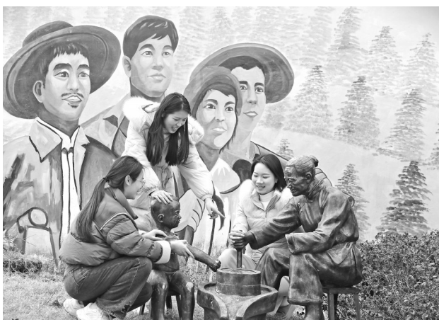
奉新县围绕乡村振兴、人居环境整治等主题，绘制内容丰富的乡村文化墙，引领文明新风。图为近日，游客在该县罗市镇港下村乡村文化墙前打卡。

经省委批准，十五届省委第七轮巡视将对九江市柴桑区、彭泽县、都昌县、赣州市南康区、赣县区、兴国县、新干县、峡江县、吉水县、永丰县、崇仁县、宜黄县等12个县市区，上饶师范学院、赣南科技学院、赣东学院、南昌医学院、江西医学高等专科学校、江西中医药大学高等专科学校、江西飞行学院等7所高校党委，江西国泰集团股份有限公司、江西长天旅游集团有限公司、省港口集团有限公司、国盛金融控股集团股份有限公司、省人才发展集团有限公司等5家企业党委开展常规巡视；对全省自然资源系统、乡村振兴资金使用监管、医保基金管理、养老服务突出问题及殡葬领域腐败乱象开展专项巡视，同时对省自然资源厅、省农业农村厅、省医疗保障局、省民政厅党组开展“回头看”；对省铁路航空投资集团有限公司党委开展巡视“回头看”。