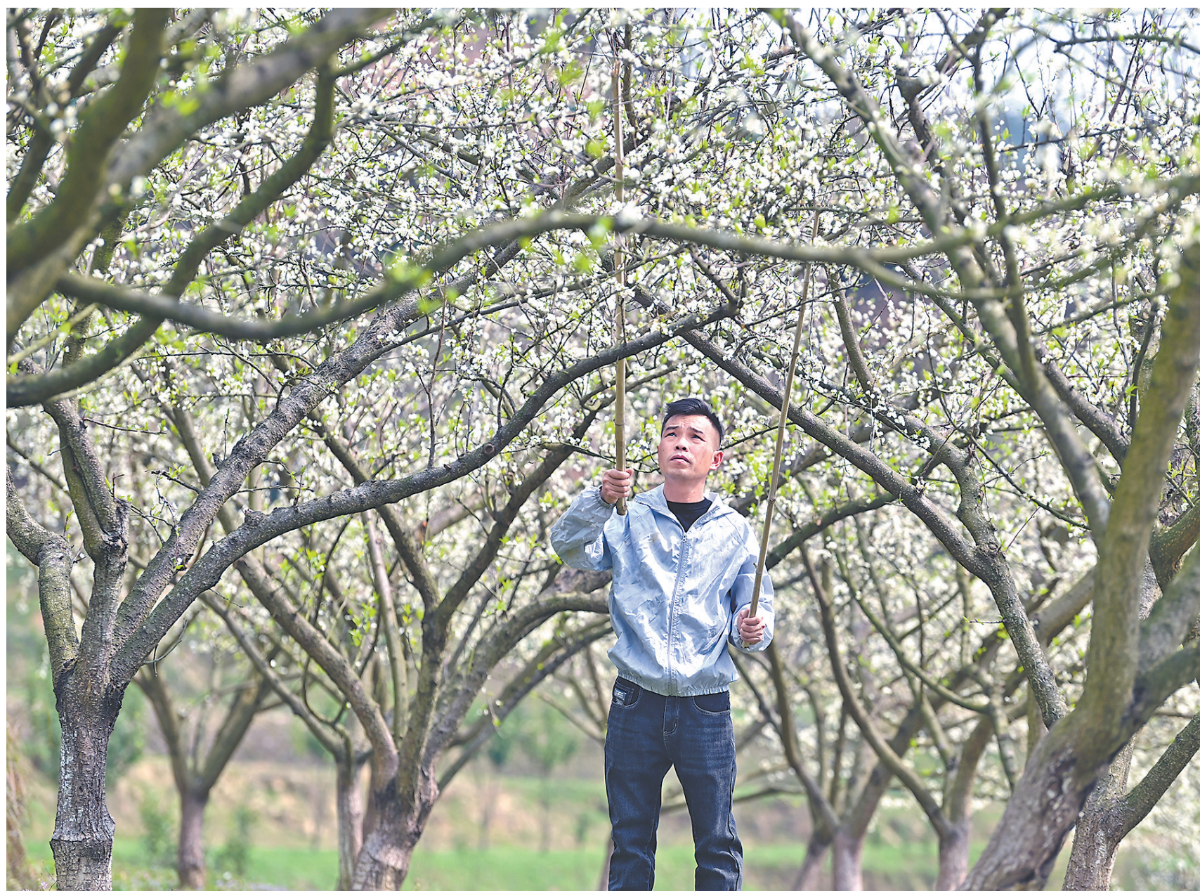
3月23日，在万载县潭埠镇昌集村，果农正在为蜂糖李树花人工授粉。