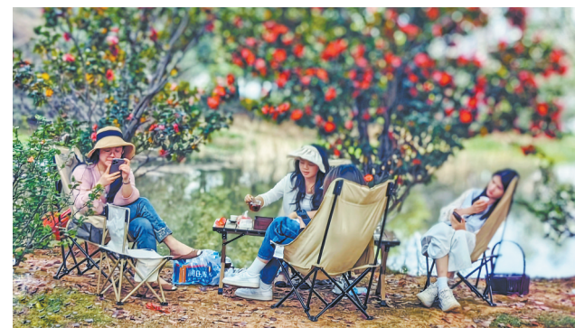
3月24日，南昌市渔舟湾湿地公园内，市民或休闲聊天或驻足拍照，享受春日好时光。

据了解，此次活动由“寻美·中国”主题活动组委会指导，中共九江市委统战部主办。活动不仅彰显了九江“江湖交汇、文脉绵长”的独特魅力，更凝聚起新的社会阶层人士力量，为文旅融合与城市发展注入新动能。