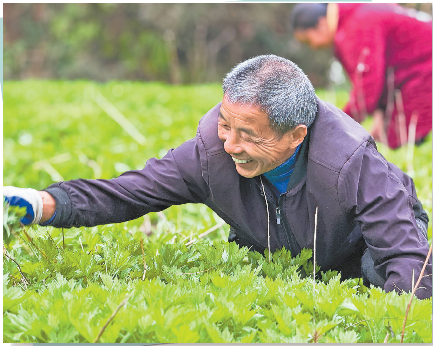
村民在古桥村艾草种植基地务工,实现家门口就业。