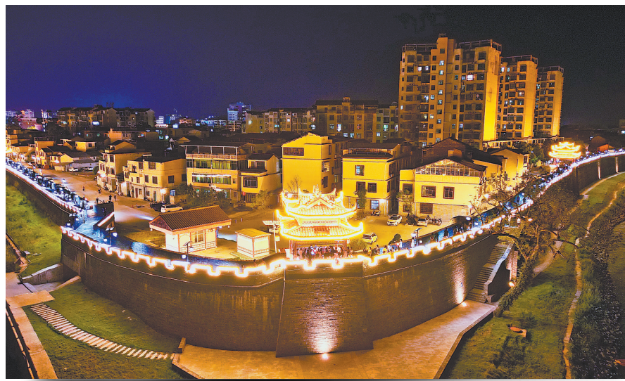
龙南城墙改造实现了防洪、景观双效果。