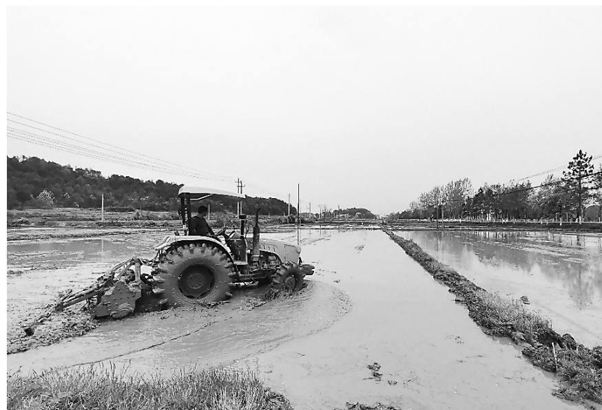
4月4日，万年县汪家乡新建村，村民驾驶农机进行水田翻耕作业，为水稻插秧做准备。