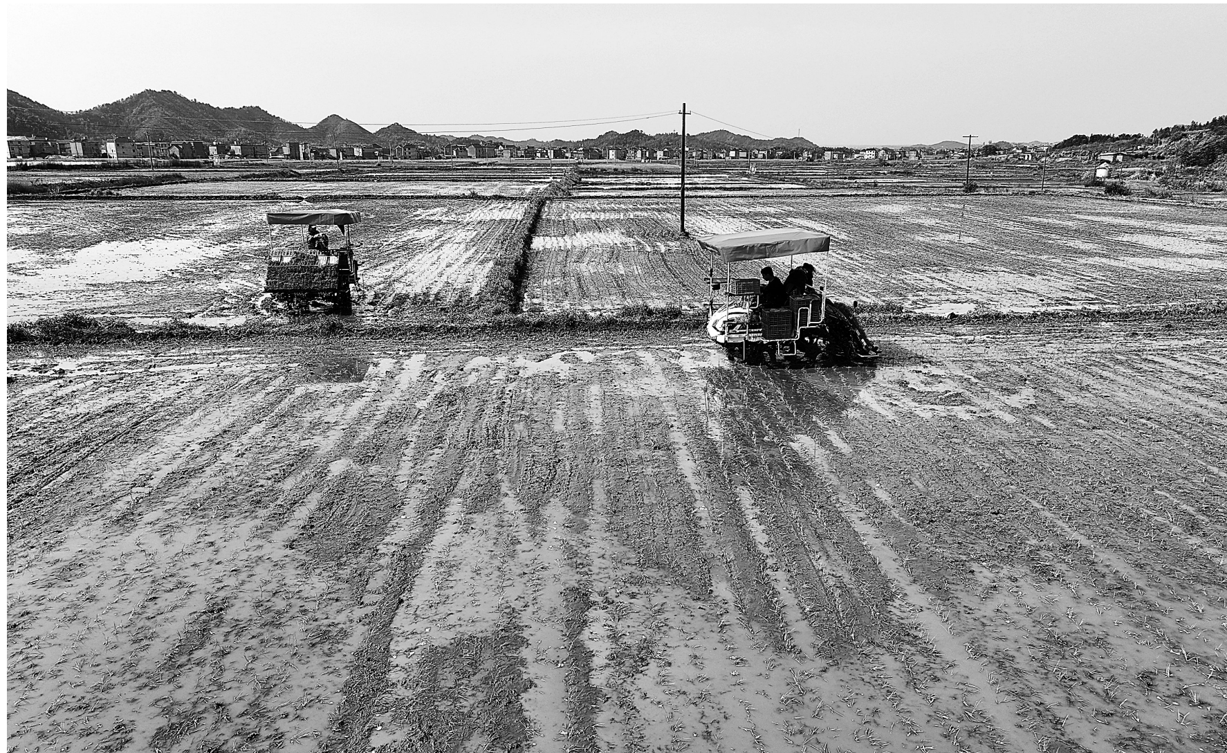
近年来，乐平市通过资金补贴等措施支持推广水稻机械化插秧。图为4月3日，双田镇农户驾驶插秧机在田间作业。

“都是乡里乡亲的，有啥矛盾不能解决呢？”3月10日，新干县三湖镇两村民因土地分界问题发生肢体冲突。三湖派出所负责人黄望接警后，联动镇村干部等调解力量赶赴现场。民警通过调取村内分田记录、实地丈量争议地块，引导双方理性协商，最终成功化解矛盾，避免事态升级。