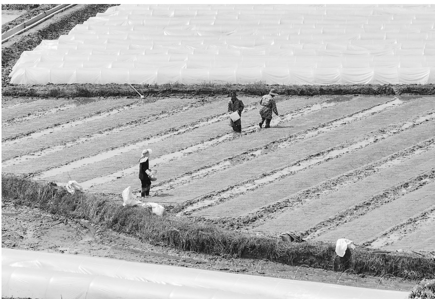
4月1日，丰城市丽村镇对木村，农民在田间开展育秧作业。