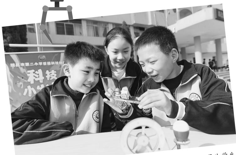
4月2日,瑞昌市第二小学首届校园科技创新节开幕。图为学生正在制作电动小飞机。