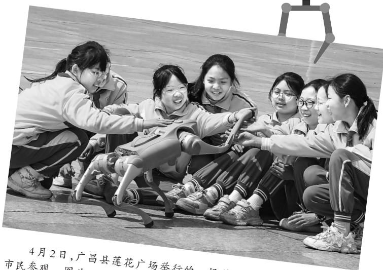
4月2日,广昌县莲花广场举行的一场科普活动,吸引不少学生和市民参观。图为孩子们与智能机器人亲密接触。