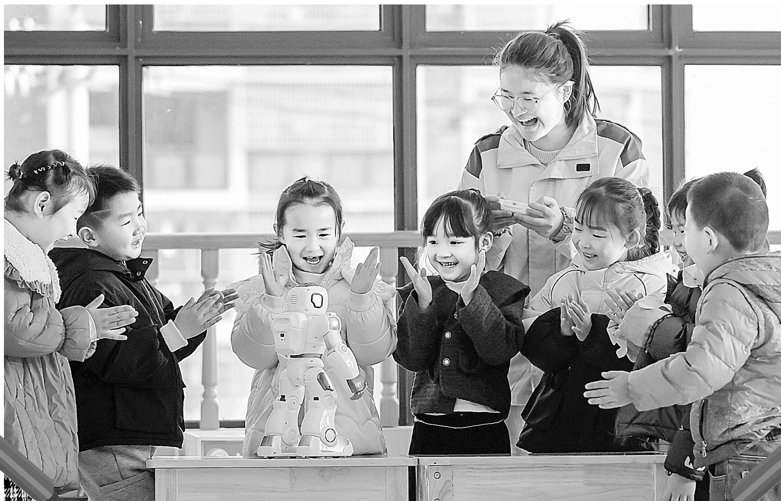
峡江县通过开展机器人进校园活动,让孩子们零距离感受人工智能魅力。图为4月1日,城西幼儿园小朋友与机器人互动。