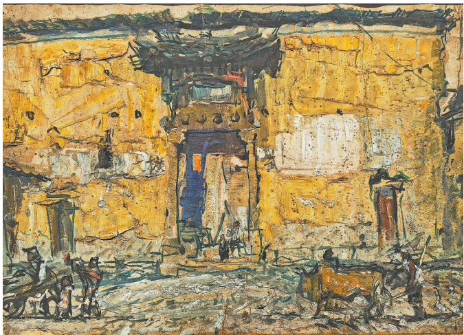
油画《老屋》马宏道绘