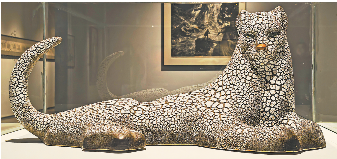
雕塑《雪豹》周国桢作

“薪火传承凝丹青——江西省美协历届主席团作品展”近日在省文联展厅举行,共展出我省美协历届主席团成员作品50余件,画种涵盖国画、油画、版画、雕塑、连环画、漆画等。展览将持续至4月17日。