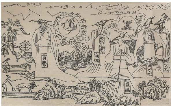
连环画《连环画(选一)》丁世弼绘