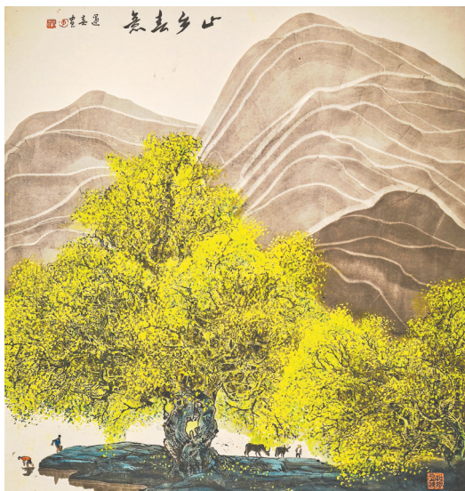
国画《山乡春意》李遇春绘

李遇春,1939年出生,中国美协会员,赣州市美协顾问。他从事美术创作60多年,在传统绘画的基础上不断创新,形成了独特的艺术风格,作品《花瀑图》入选全国第八届美展。展期至4月15日。