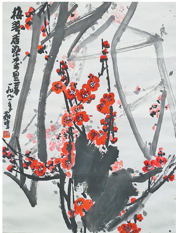
国画《梅花香染万里香》燕 鸣绘