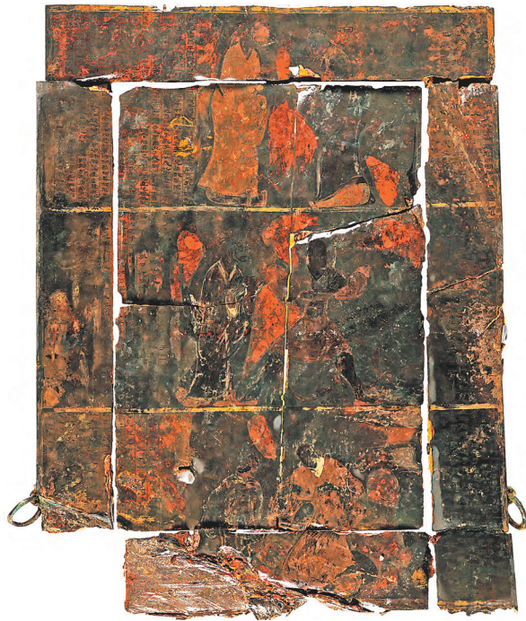
南昌西汉海昏侯墓出土的“漆绘衣镜”

从商周以来,依托在漆器上的“漆画”,不仅从两汉的金银纹饰镶嵌、魏晋的彩漆描绘、宋元螺钿镶嵌到明清时期的刻灰、犀皮、宝砂等漆器装饰工艺汲取绘画技艺精华,更在艺术形式上从最初的几何图案