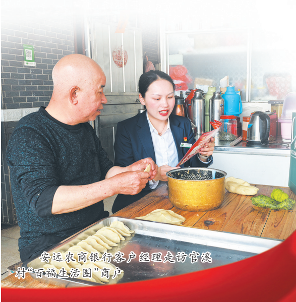
安远农商银行客户经理走访官溪村“百福生活圈”商户