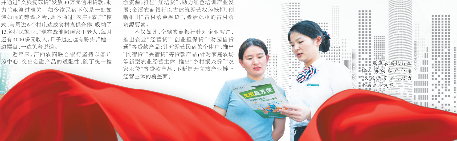
鹰潭农商银行工作人员向客户介绍“文旅复苏贷”,助力文旅产业发展