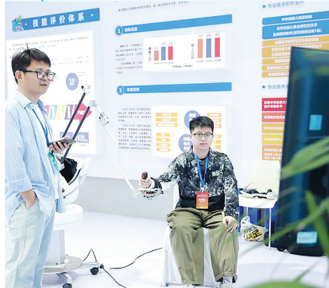
工作人员通过VR演示手臂康复

值得一提的是，活动全程向公众开放，并设置互动体验区。观众可观看国家级技能大师现场展示蓝印花布印染、茶文化与茶艺、陶瓷拉坯，体验金溪县的雕版印刷，品尝鹰潭市的糕点、永修县的小龙虾……这种沉浸式观赛模式，让技能竞赛从小众赛场走向大众舞台。