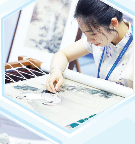
遗产代表性项目夏布绣