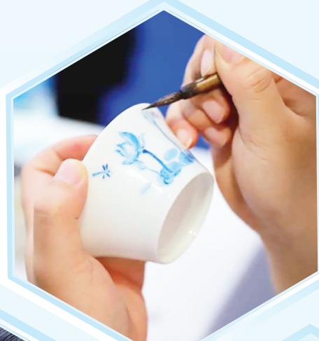
市民体验陶瓷绘画