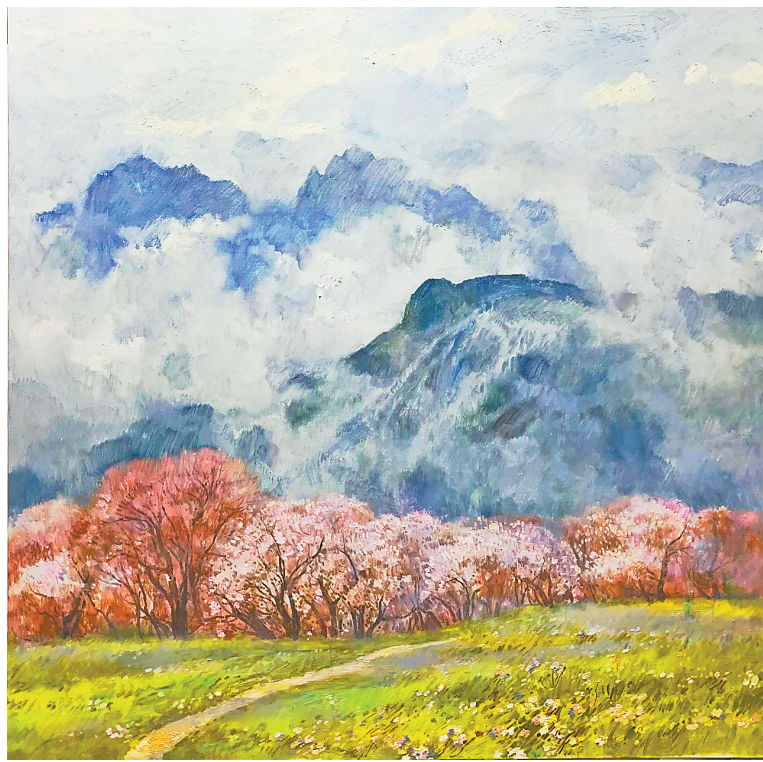
《井冈山春意》孙立新绘