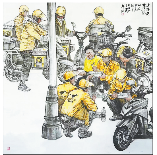
国画《快乐工作餐》郭江绘