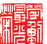
篆刻《劳动最光荣》 尧在通刻