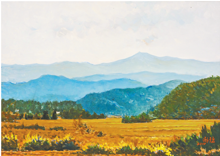
《井冈山远景》靳尚谊绘