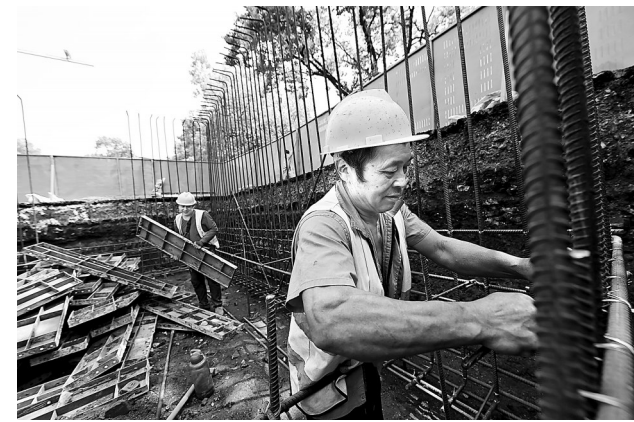
5月1日,万载县康乐街道沿河西路排水项目施工现场,建设者坚守一线,加紧施工。

为进一步释放消费潜力,袁州区商务局推出双品网购节暨红动五月智慧全城消费季活动,市民在现场购买电动自行车、家电等消费品,可直接享受国家补贴。“五一”假期,该区用美食、音乐和消费活力,点亮城市夜生活。