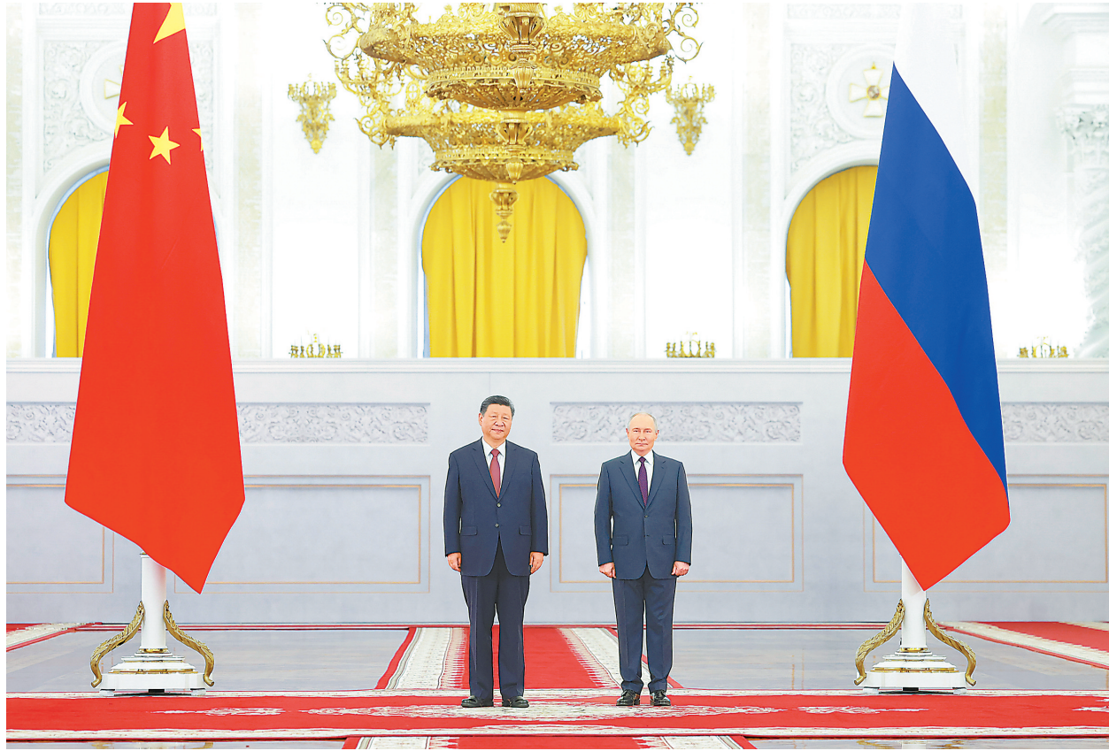
当地时间5月8日上午，俄罗斯总统普京同中国国家主席习近平在莫斯科克里姆林宫举行会谈。这是普京在乔治大厅为习近平举行隆重欢迎仪式。