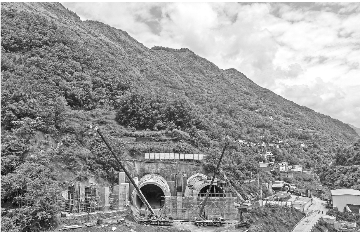
▲5月8日，中铁五局的建设者在渝昆高铁彝良隧道内进行瓦斯检测。