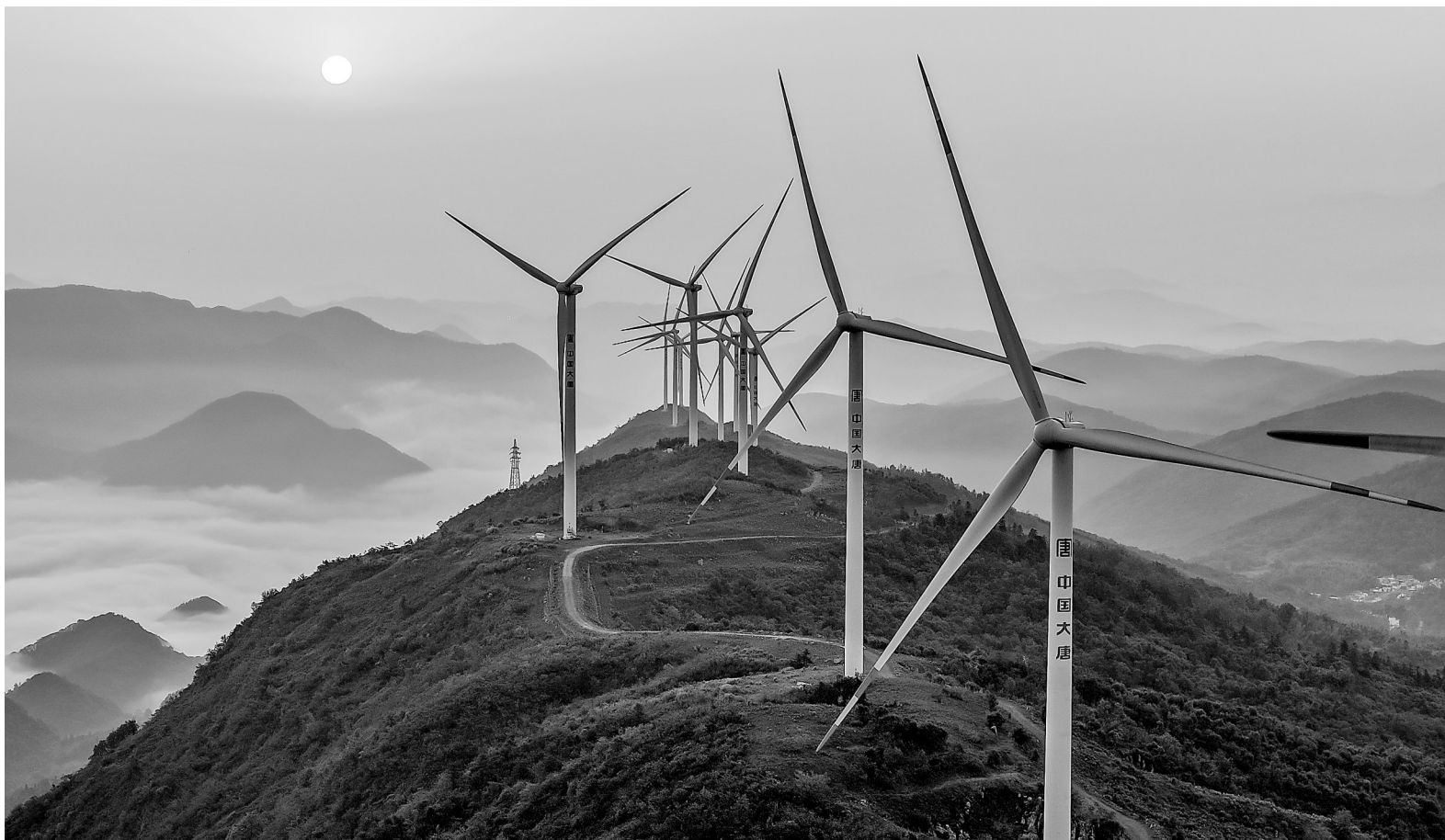
5月6日，航拍瑞昌市洪下乡蜈蚣山风电场，一台台发电机矗立在群山云海之中，壮美如画。

为加强对专项资金的监管，提高效率，该市制定出台了专项资金使用管理办法，专项资金项目由乡镇政府、街道办事处组织实施，乡镇(街道)人大、纪检监察、财政等部门共同监督。代表联络站邀请代表全程监督项目招标、建设、验收等各个环节，代表的履职角色从“旁观者”转为“参与者”，履职方式由“虚”到“实”，主体作用得到充分发挥。