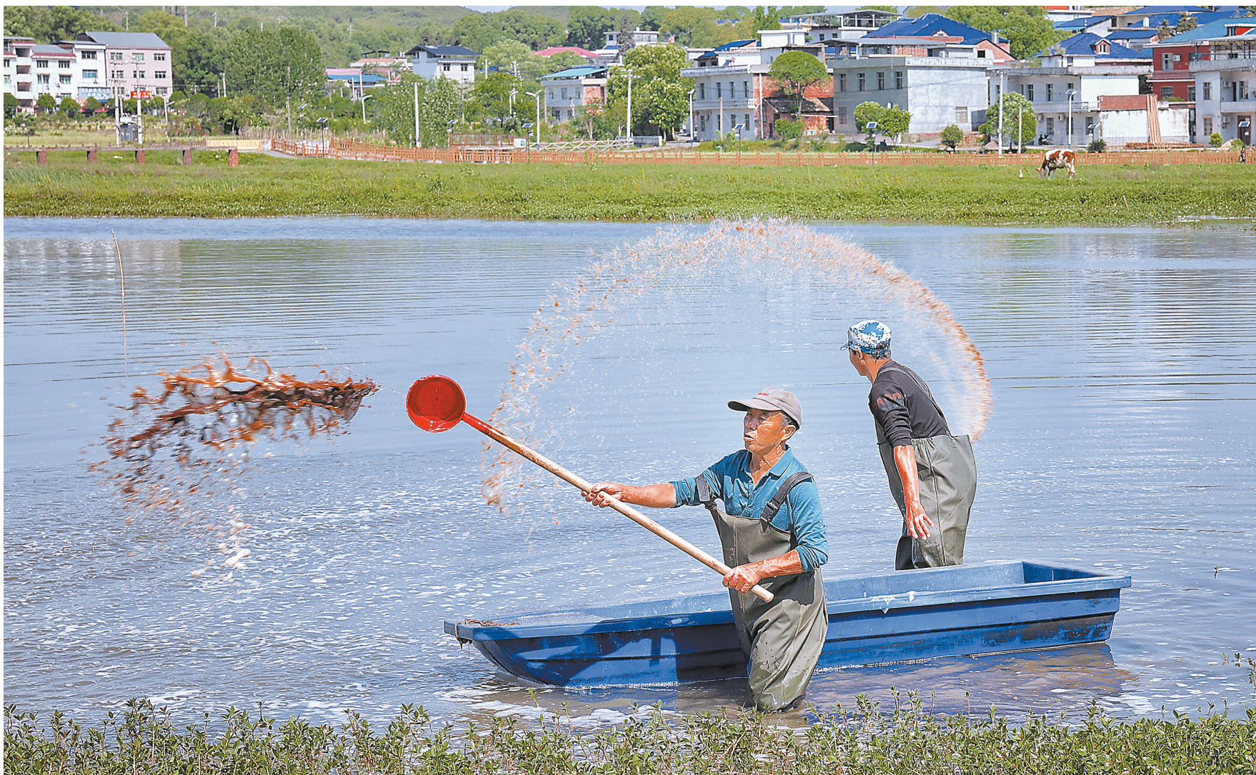
近日，萍乡市湘东区腊市镇腊市村虾农忙于洒泼茶枯水，确保虾塘水质、生态平衡和龙虾健康生长。