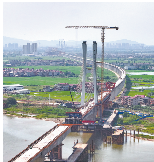
南昌隆兴大桥南支项目施工稳步推进。图为5月9日，施工工人正在进行预应力筋穿束作业。

2020年，大智石刻景区获评江西省4A级乡村旅游点。开园至今累计接待游客200余万人次，营业收入8000万元，带动500余名当地村民就业增收。