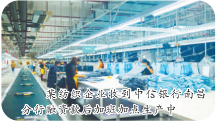
某纺织企业收到中信银行南昌分行融资款后加班加点生产中