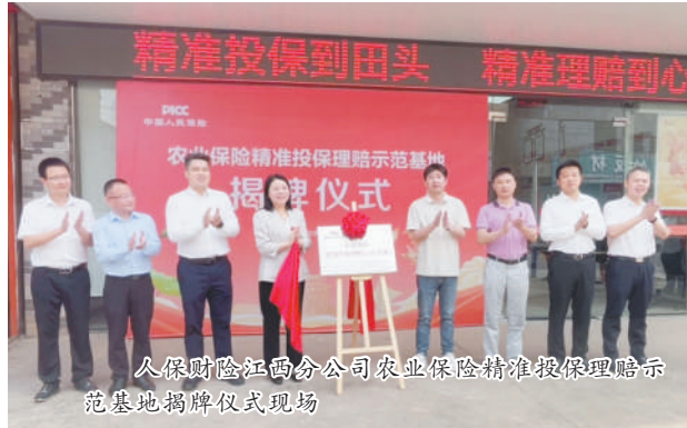
人保财险江西分公司农业保险精准投保理赔示范基地揭牌仪式现场