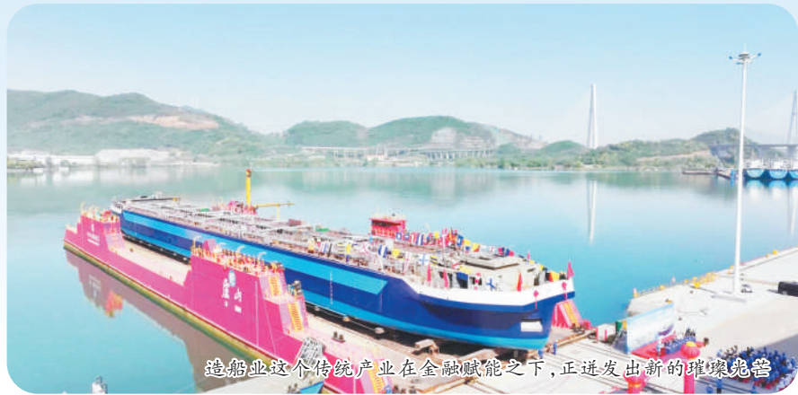
造船业这个传统产业在金融赋能之下,正迸发出新的璀璨光芒

从昌北国际机场起飞的货运包机里,满载着南昌针纺企业赶制的球迷衫。在跨越山海的贸易通道上,金融创新正与产业升级同频共振,为江西外向型经济高质量发展书写新的注脚。在江西民营经济的热土上,一场金融创新正为中小外贸企业注入澎湃动能——深耕赣鄱大地十八载的中信银行南昌分行,瞄准省内特色产业精准施策,精准破解融资困局,通过外向型积分卡审批机制,为各产业集群打开跨境金融新通道,助力“江西制造”扬帆出海。