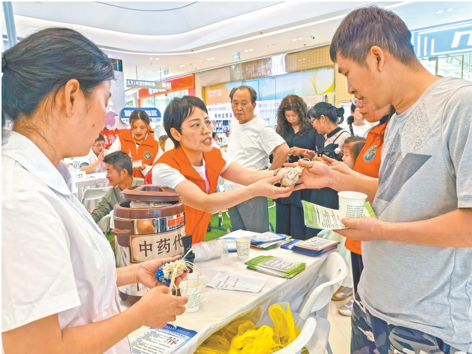
▲上饶市广丰区依托基层医疗机构，持续推动中医药优质服务和资源下沉。图为近日在桐墩镇中心卫生院针灸理疗室，专业中医师正为腿部关节痛的老年患者进行艾灸治疗。