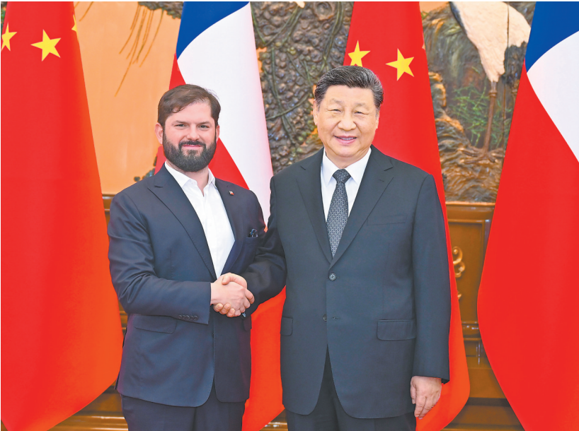
5月14日上午，国家主席习近平在北京人民大会堂会见来华出席中拉论坛第四届部长级会议的智利总统博里奇。

中方愿同哥方共同努力，推动两国战略伙伴关系取得更大发展，更好造福两国人民。双方要巩固政治互信，加强战略沟通，把牢双边关系发展方向。要以哥伦比亚正式加入高质量共建“一带一路”大家庭为契机，推动两国合作提质升级。中方愿进口更多哥伦比亚优质产品，支持中国企业赴哥投资兴业，参与基础设施建设。双方