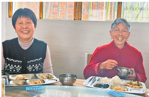
在幸福食堂用餐的老年人。