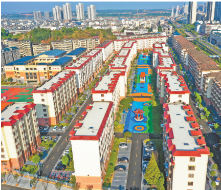
改造后的老旧小区。

5月10日中午,瑞昌市肇陈镇大林村幸福食堂里饭菜飘香,75岁的柯大爷刷完老年助餐卡,端着餐盘和邻居们围坐一桌,欢声笑语不断。大林村常住老年人近300人,独居老人买菜难、高龄老人做饭不便等问题长期困扰村民。今年初,当地人大代表积极与相关部门协调,争取政策支持与资金投入。在多方努力下,今年3月,大林村幸福食堂正式运营。