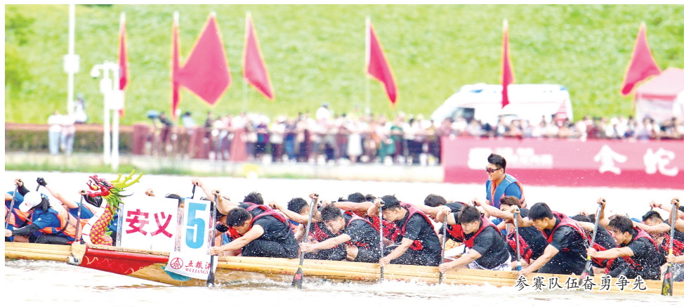
参赛队伍奋勇争先