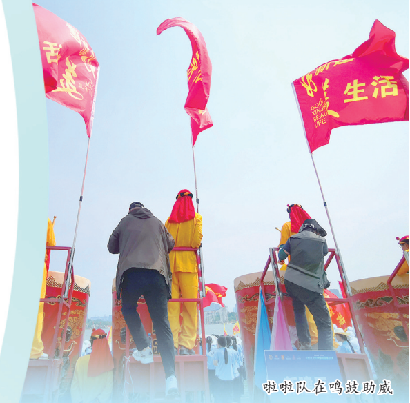
啦啦队在鸣鼓助威