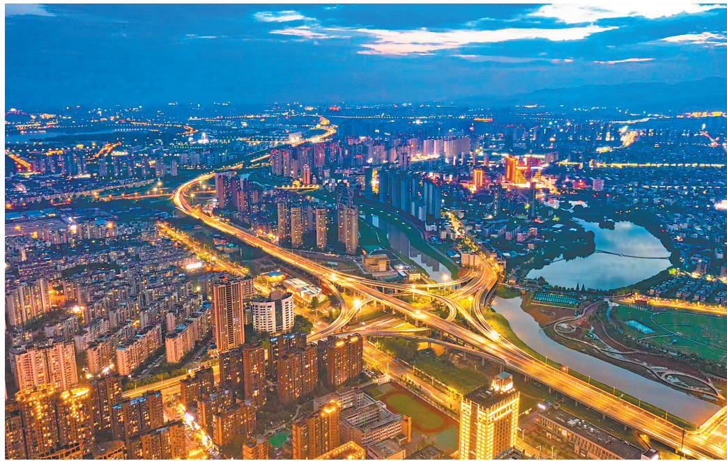
傍晚的南昌市新建区，华灯初上，夜色璀璨。